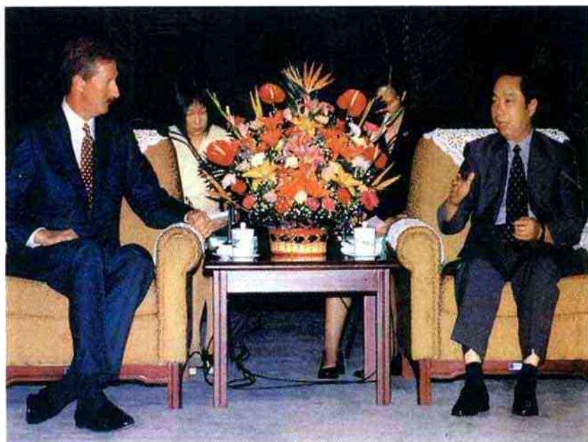
2001年7月，温安洛与国家工商局局长 王众孚(右)亲切交谈