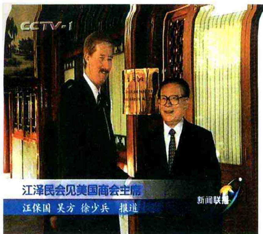
2001年7月6日，国家主席江泽民 会见美国商会主席、美国安利公司 董事长史提夫·温安洛