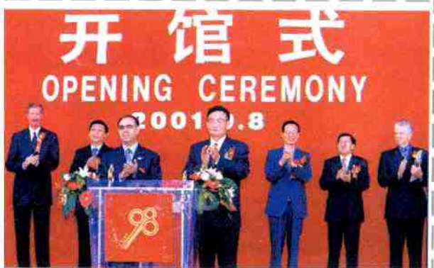
2001年9月8日在厦门国务院副总理吴邦国（中）主持第五届中国投资贸易洽谈会开馆式