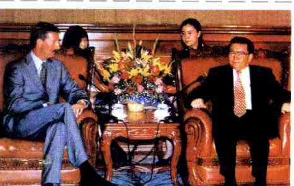
9月史提夫·温安洛先生与中共中央政治局委员、广东省委书记李长春（右）亲切会谈