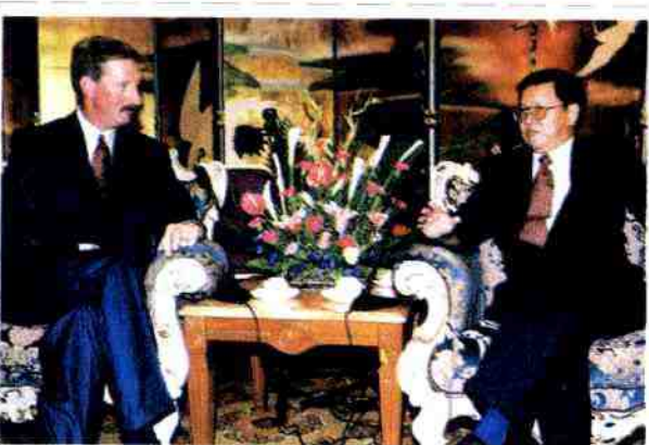
温安洛主席与外经贸部部长石广生（左）互赠礼物