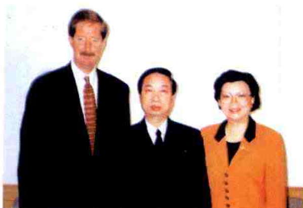
1996年10月，美国安利公司主席史提夫·温安洛专程到北京与国务院副总理李岚清（左图）、国家工商行政管理局局长王众孚（右图）会面交流。