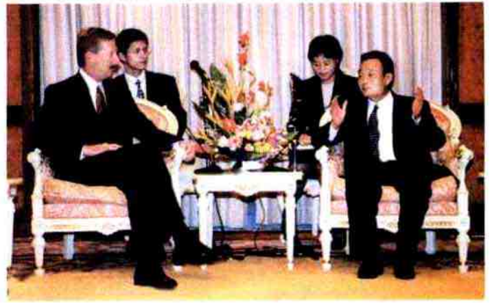
2001年9月在厦门史提夫·温安洛先生与国务院副总理吴邦国(右)亲切会谈