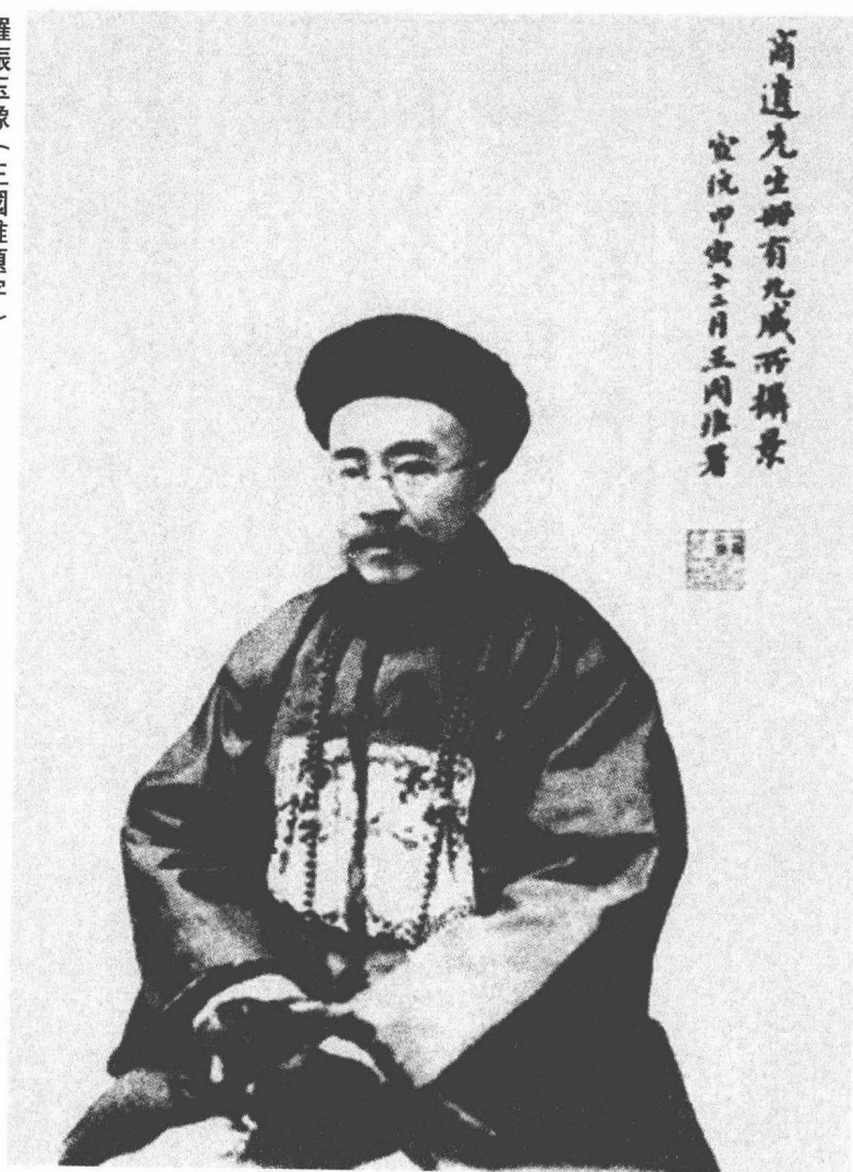
羅振玉像（王國維題字）