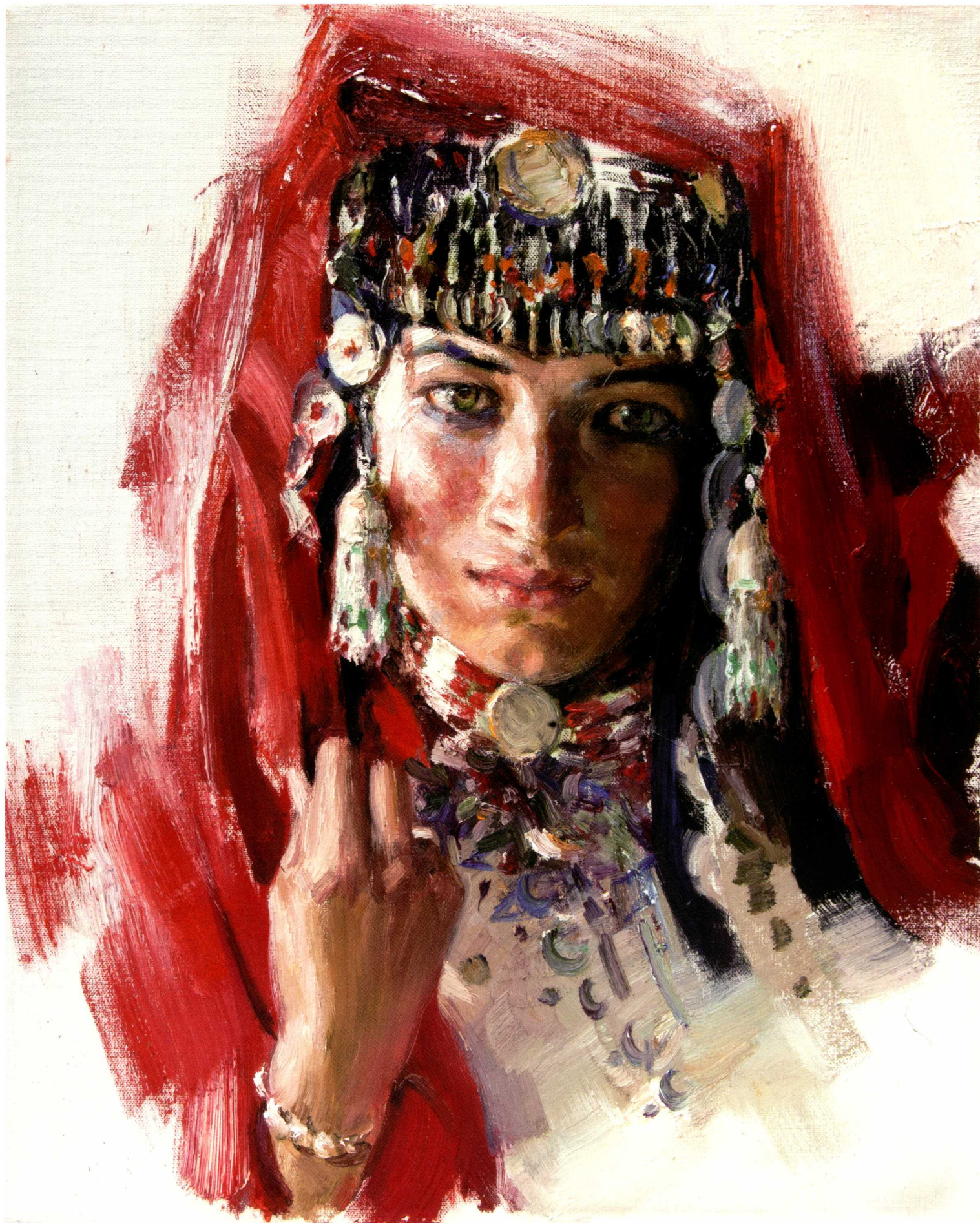
塔吉克姑娘 50cm×40cm 2010年