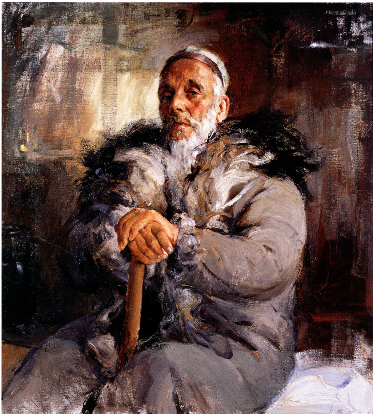
维吾尔百岁老人买买提 100cm×90cm 2007年

全山石 ，1930年10月生于浙江省宁波市，中共党员。1953年毕业于中央美术学院华东分院，留校任研究员。1954年由国家选派赴苏联列宁格勒列宾美术学院学习。1960年毕业，获艺术家称号。同年回国，一直任教于浙江美术学院（即中国美术学院），曾任该院油画系主任，院教务长等职，主持油画系第三画室，培养了许多本科生、研究生和青年教师。历任国家教委艺术教育委员会委员，中国油画学会副主席、中国美术家协会油画艺术委员会副主任、中国美术学院教授、俄罗斯列宾美术学院荣誉教授、乌克兰艺术科学院院士等。