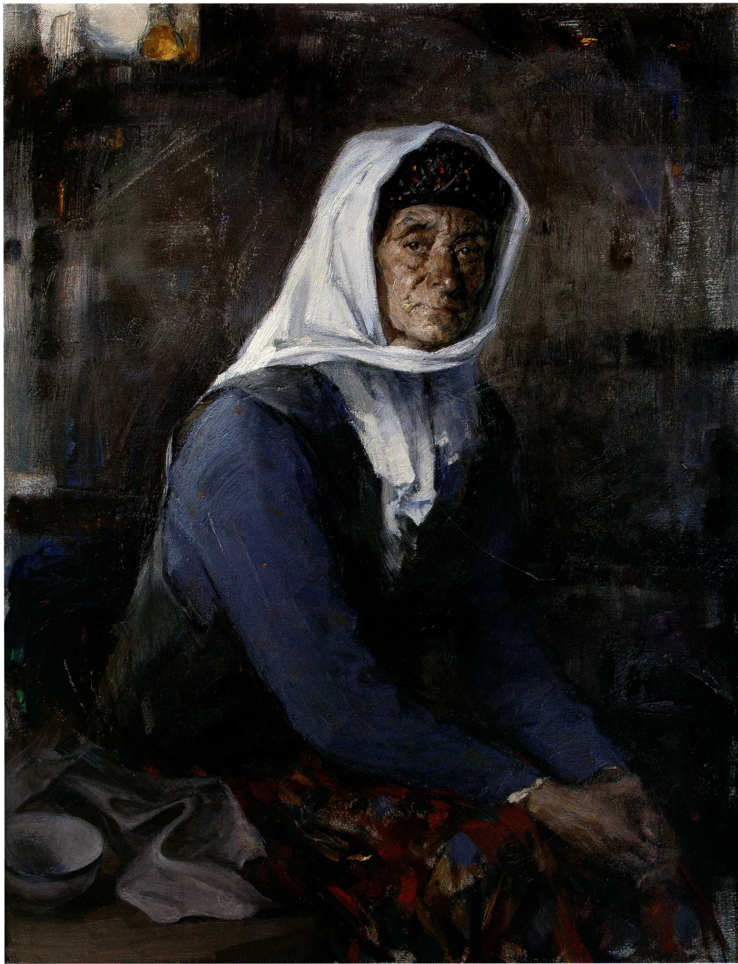
塔吉克老妇 116cm X 89cm 2010年