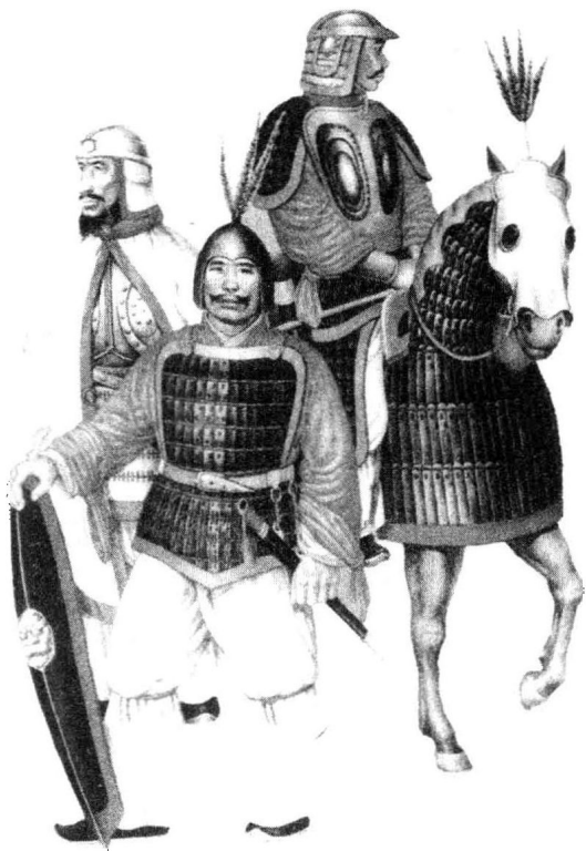
南北朝武士复原图

江而上，袭取丹徒，拥众十余万人，楼船千余艘，军容极盛。时晋廷兵力空虚，内外戒严，急调兵遣将防卫京师。刘牢之自山阴引兵攻打义军，但未至而义军已过山阴，便令刘裕自海盐驰援京师。时刘裕部不满千人，倍道兼行，与义军一起进抵丹徒。刘裕部兵少且疲，而丹徒守军也没有斗志。孙恩指挥数万义军抢占镇江之蒜山，刘裕率领所部奔击，大破之，投崖赴水死者甚众。孙恩失利，退至船上，欲恃其兵众，整兵直攻建康(今江苏南京)。晋后将军司马元显率军拒战，屡被打败。义军因战船高大，逆行慢，数日才进至白石垒(今南京市西)，贻误了战机，所以刘牢之等得以率军尾追而来。孙恩遂放弃攻建康，分兵袭取北岸之广