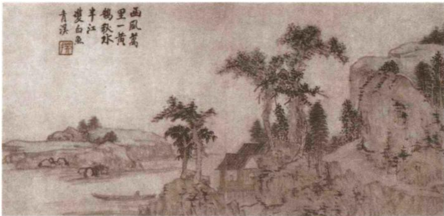
山水图之二 明·程正揆

yán duì gé yì duì tóng bái sǒu duì huáng ② 沿对革 ① ，异对同，白叟对黄 tóng jiāng fēng duì hǎi wù mù zǐ duì yú wēng 童 ② 。江风对海雾，牧子对渔翁。 yán xiàng lòu ruǎn tú qióng jì běi duì liáo dōng 颜巷陋 ③ ，阮途穷 ④ ，冀北对辽东。 chí zhōng zhuó zú shuǐ mén wài dǎ tóu fēng liáng dì 池中濯足水 ⑤ ，门外打头风 ⑥ 。梁帝 jiǎng jīng tóng tài sì hàn huáng zhì jiǔ wèi yāng gōng 讲经同泰寺 ⑦ ，汉皇置酒未央宫 ⑧ 。 chén lǜ yíng xīn lǎn fǔ qī xián lǜ qī shuāng 尘虑萦心 ⑨ ，懒抚七弦绿绮 ⑩ ；霜 huá mǎn bìn xiū kàn bǎi liàn qīng tóng 华满鬓 ⑪ ，羞看百炼青铜 ⑫ 。