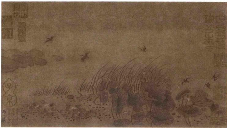
荷塘飞燕图 南宋·佚名

3 贫对富，塞对通，野叟对溪 童。鬓皤对眉绿 ① ，齿皓对唇红。 天浩浩，日融融，佩剑对弯弓。半 溪流水绿，千树落花红。野渡燕 穿杨柳雨，芳池鱼戏芰荷风 ② 。女 子眉纤，额下现一弯新月；男儿气 壮，胸中吐万丈长虹 ③ 。