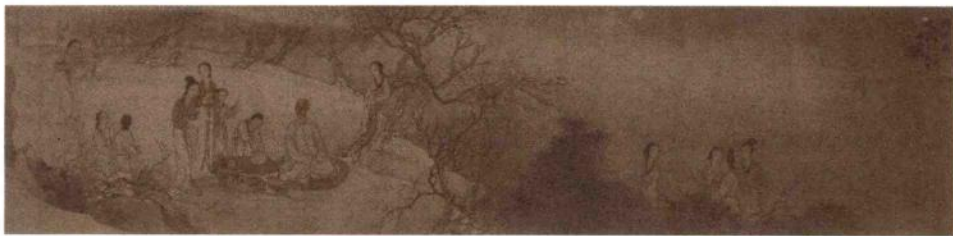
姚燮怀绮图 清·费丹旭

注释：①禹舜对羲农：禹、舜、羲、农即夏禹、虞舜、伏羲氏和神农氏，四人均是古代传说中贤明的君主。②云叶：《史记》载：黄帝与蚩尤战于涿鹿之野，常有五色云彩聚于帝之上空，形状如金玉叶。③陈后主：南朝时陈朝的末代皇帝，名叔宝，后被隋所灭。④汉中宗：即西汉宣帝刘询，在位二十五年。⑤绣虎：《三国志·魏书》称曹植为文坛“绣虎”，言其文思敏捷，诗文富有文采与风骨。雕龙：战国时代的驷爽精于辞章，像雕刻龙纹一样精雕细琢，《史记》称其为雕龙。⑥邀功：建功立业。邀：追求。⑦干戈：干和戈是古代的两种兵器，用作兵器的总称，借指战争。⑧逸民：古代指避世隐居、不问政事之人。适志：顺心如愿。⑨疏慵：懒散怠慢。