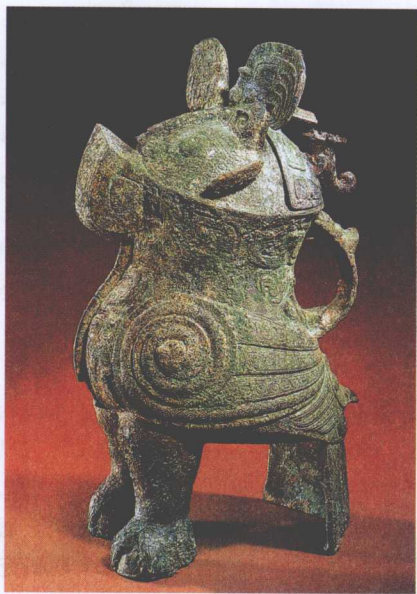
妇好是商朝第23代王武丁的配偶，其墓位于河南省安阳市小屯村西北约100米处。图为妇好墓出土的鸮尊。

商朝是中国历史上继夏之后存在时间较长的一个王朝。从公元前17世纪商汤灭夏后建立，到公元前11世纪被周朝