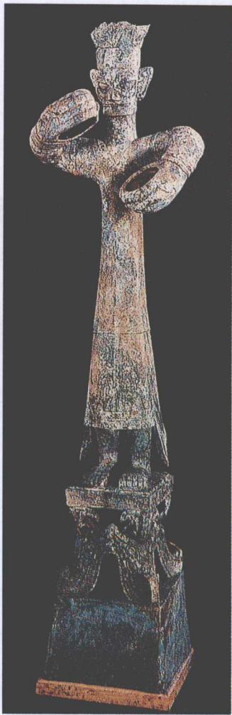
四川广汉三星堆出土的商代大型青铜人立像

三星堆文化 1929年春天，四川广汉月亮湾的一位农民在挖水沟的时候，不经意间触动了一块色彩斑斓的玉石。此后人