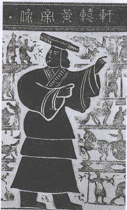
轩辕黄帝像(山东武梁祠石刻)

三皇五帝是中国最早的古史系统,最早见于《周礼》,但没明确说明都是哪些人。其他古代文献中关于三皇五帝的说法更是多种多样、莫衷一是。可能属于三皇的人物有伏羲、女娲、神农、燧人等;关于五帝,比较流行的说法是指黄帝、颛顼、帝喾、帝尧、帝舜。近年来有学者根据考古学、民族学、人类学的新成果,结合文献材料进行了深入研究,认为三皇