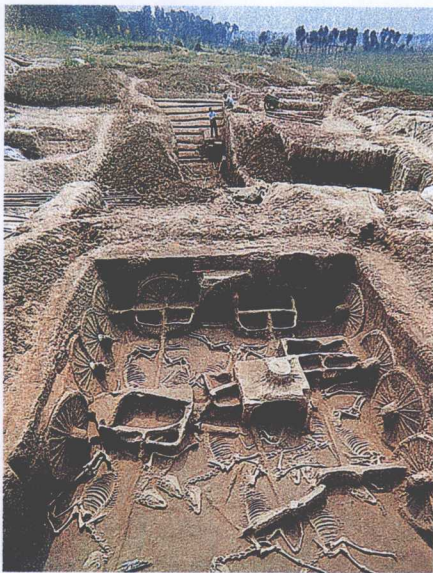
北京琉璃河西周车马坑遗址

西周是中国历史上的第三个王朝，从武王灭商建国，到幽王亡国，共历 300 多年。武王、成王时期，在周公的辅佐下，周王朝制定了比较完备的政治、经济制度，促使社会经济迅速发展。昭王、穆王时期，不断对外征伐，国力逐渐削弱。宣王时期，西周国力得到短暂的恢复。但到幽王时，他却任用奸臣，沉溺酒色，不理国政。公元前 771 年，少数民族犬戎攻破镐京（今西安），西周灭亡。西周是中华古典文明的全盛时期，其物质文明与精