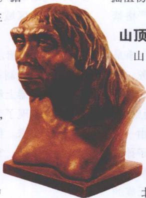
根据头盖骨复原的北京人像

山顶洞人生活在中国旧石器时代晚期。化石于 1933 年发现于北京周口店龙骨山的山顶洞穴中，距今约 18 000 年。洞中发掘出至少 8 个个体，形态特征与现代人基本一致。山顶洞人以渔猎、采集生活为主，使用