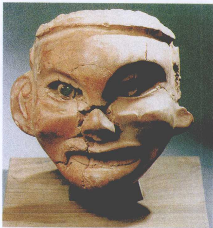
辽宁牛河梁女神庙遗址出土的红山文化彩塑女神头像

的小山。它方圆1万余亩，全部由红色花岗岩构成，因此被称为红山。它不仅景色宜人，更以红山文化闻名于世。