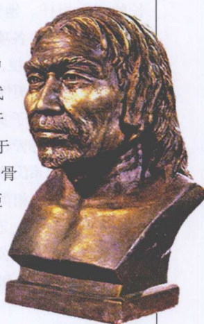
根据头盖骨复原的山顶洞人像