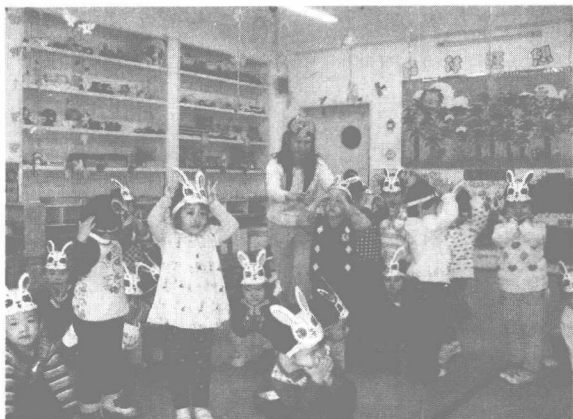
图1-2 幼儿音乐欣赏活动