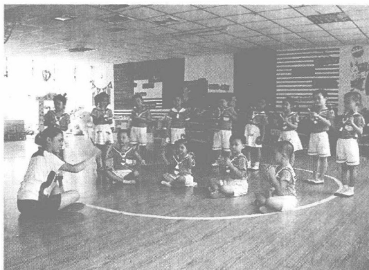
图1-3 幼儿打击乐活动

打击乐活动是培养儿童节奏感最重要的途径。儿童在打击乐活动中对音乐的节奏、节拍、强弱等有更直接的认识，同时能够更熟练地掌握各种乐器的音色和使用方法，提高对音色的听辨能力及对各种音乐表现手段的敏感性（图1-3）。