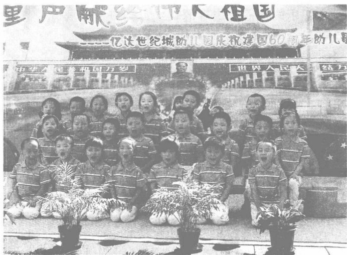
图1-1 学前儿童歌唱活动

“嗓音乐器”，所以开展唱歌活动可不受客观条件限制，只要孩子们愿意，可随时随地进行。教师应选用适合学前儿童年龄特点的儿童歌曲，选用灵活有效的教学方法，通过生动有趣的活动形式，在使学前儿童掌握歌唱技能的同时，增强他们对音乐的感受能力和理解能力，培养他们对歌唱活动的兴趣和爱好，并充分发挥歌曲的教育作用（图1-1）。