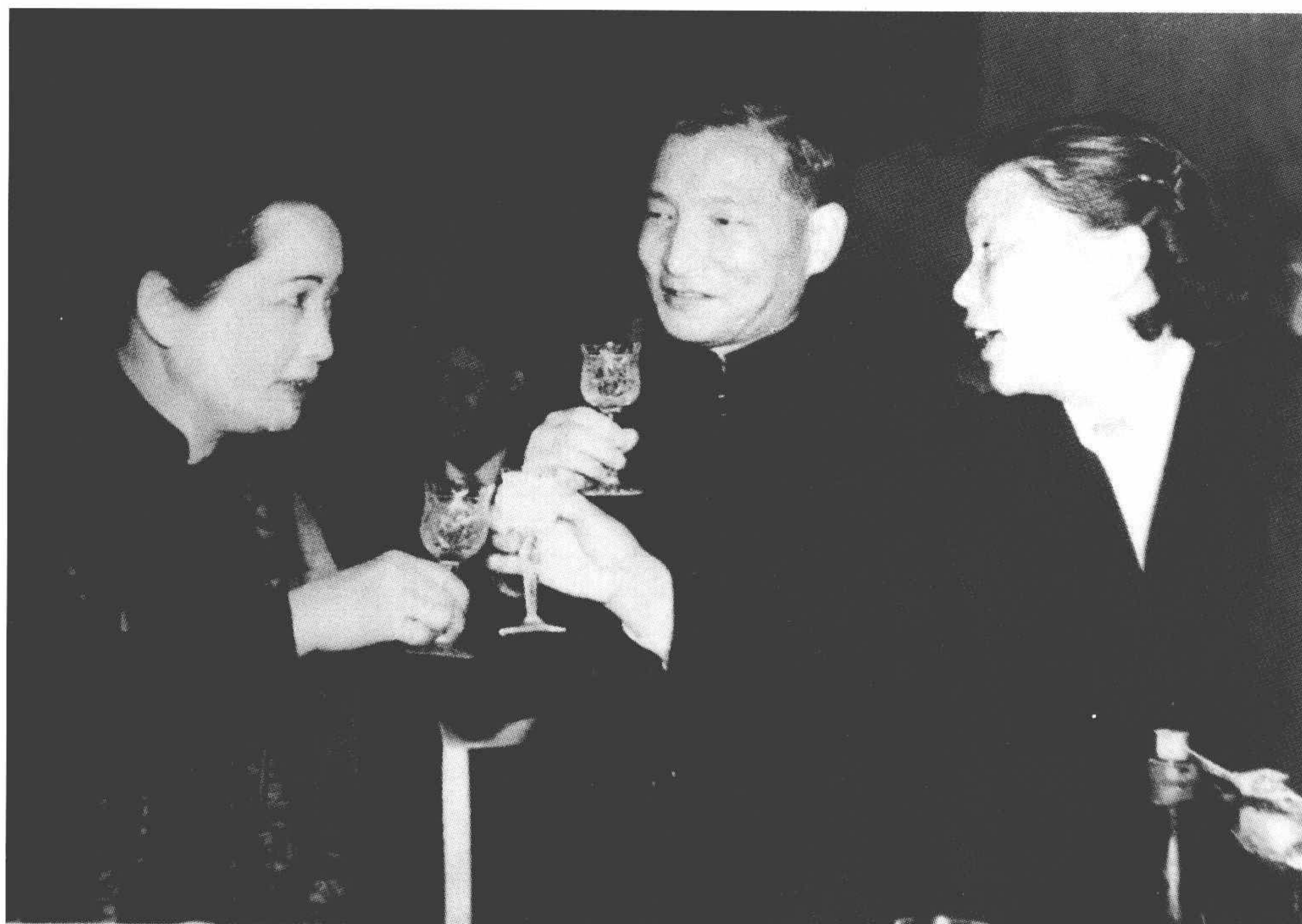
1951年，宋慶齡、陳雲和康克清在酒會上。