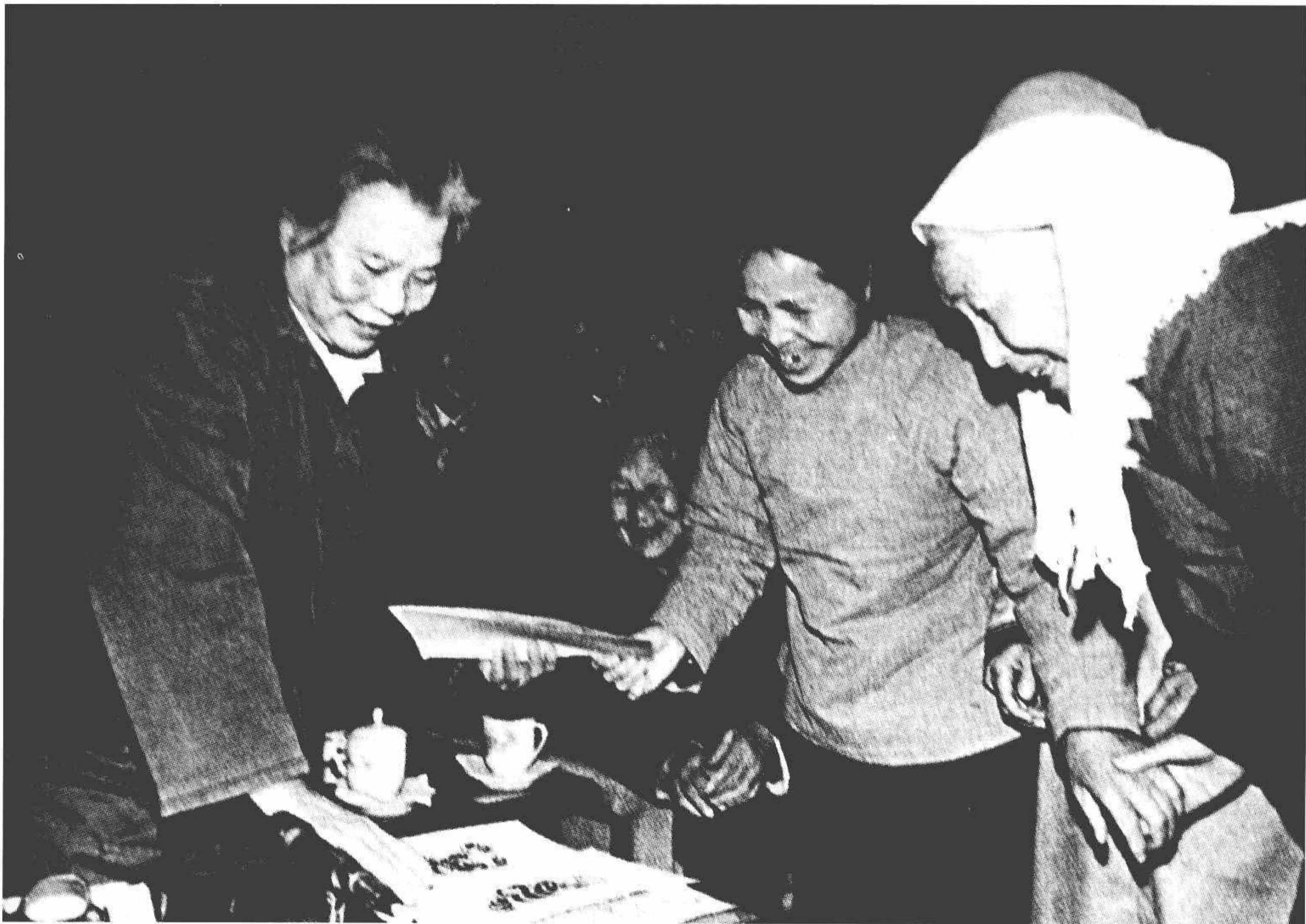
1986年，康克清与农民画家李凤兰一起欣赏她的剪纸（中坐者为戎冠秀）。