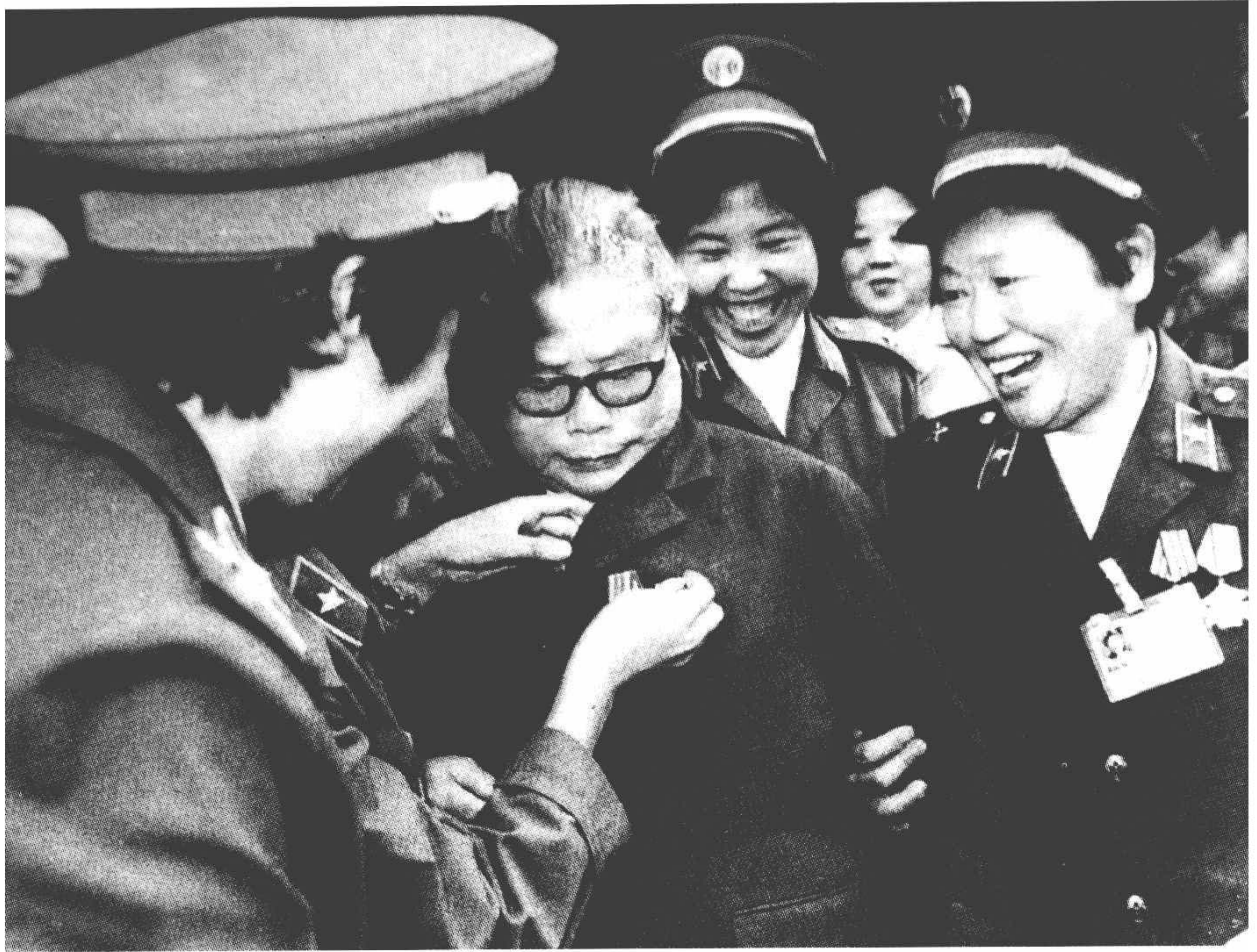
1985年，康克清与解放军女英模在一起。