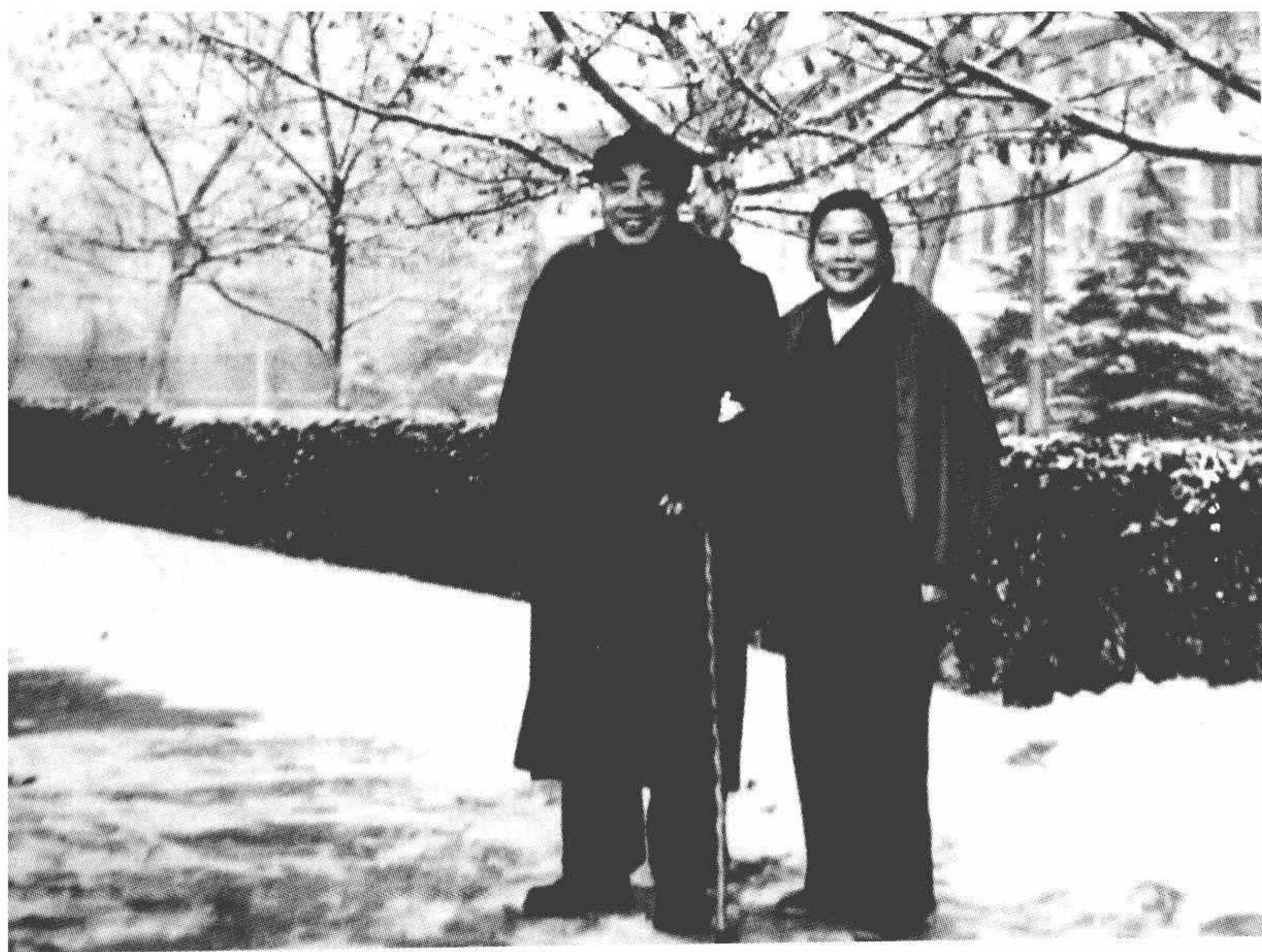
朱德与康克清在中南海。