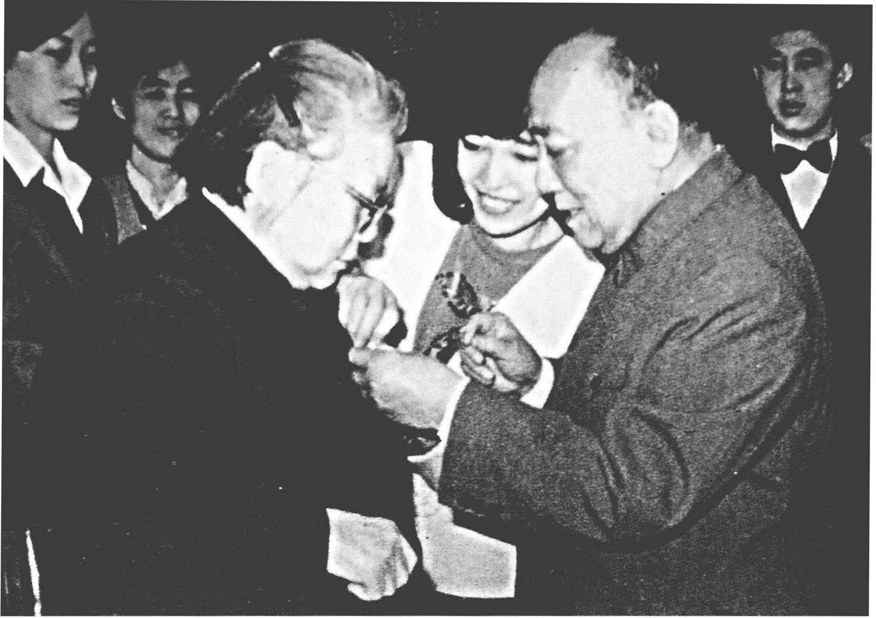
1989年3月8日，杨尚昆为康克清佩戴纪念章。