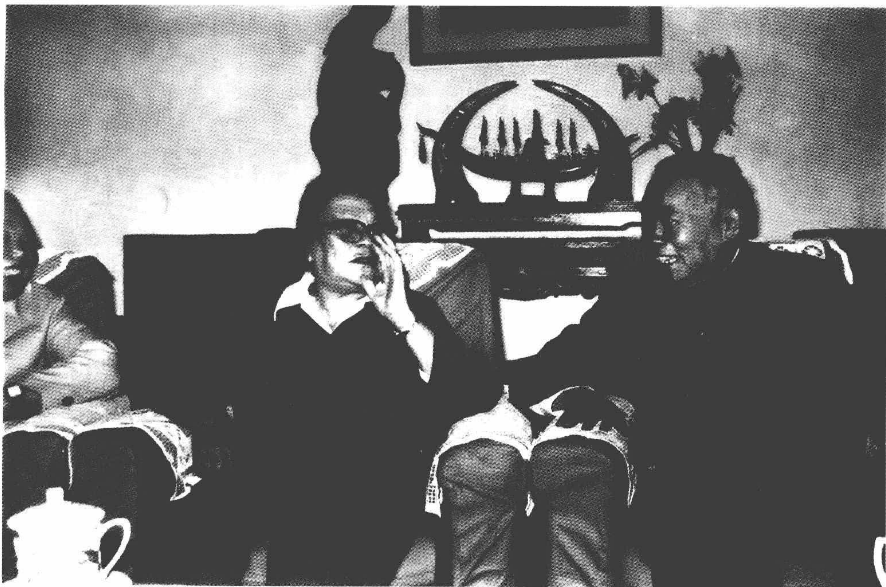
1987年，康克清与朱学范在亲切交谈。