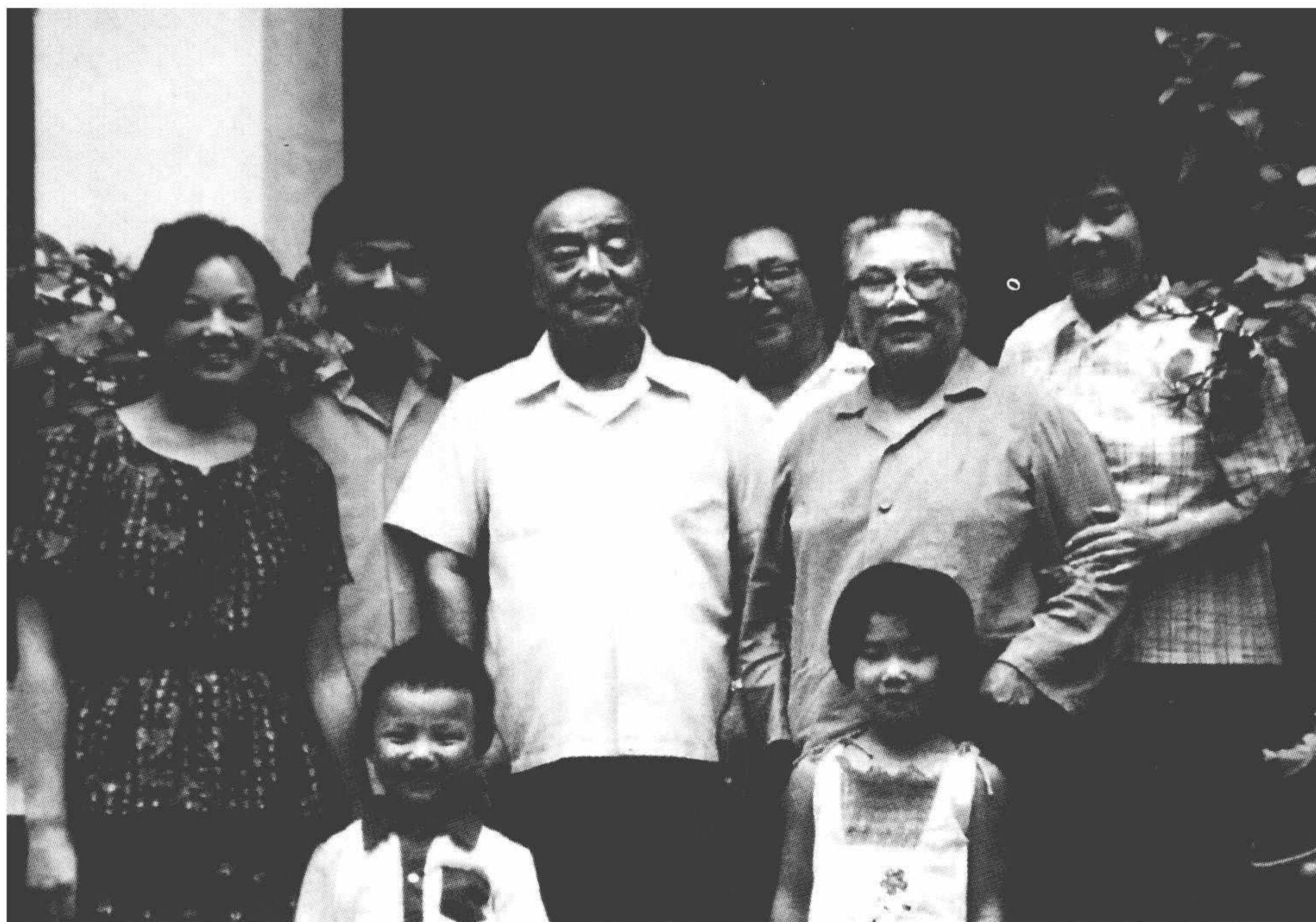
1987年夏，杨尚昆和康克清一家。