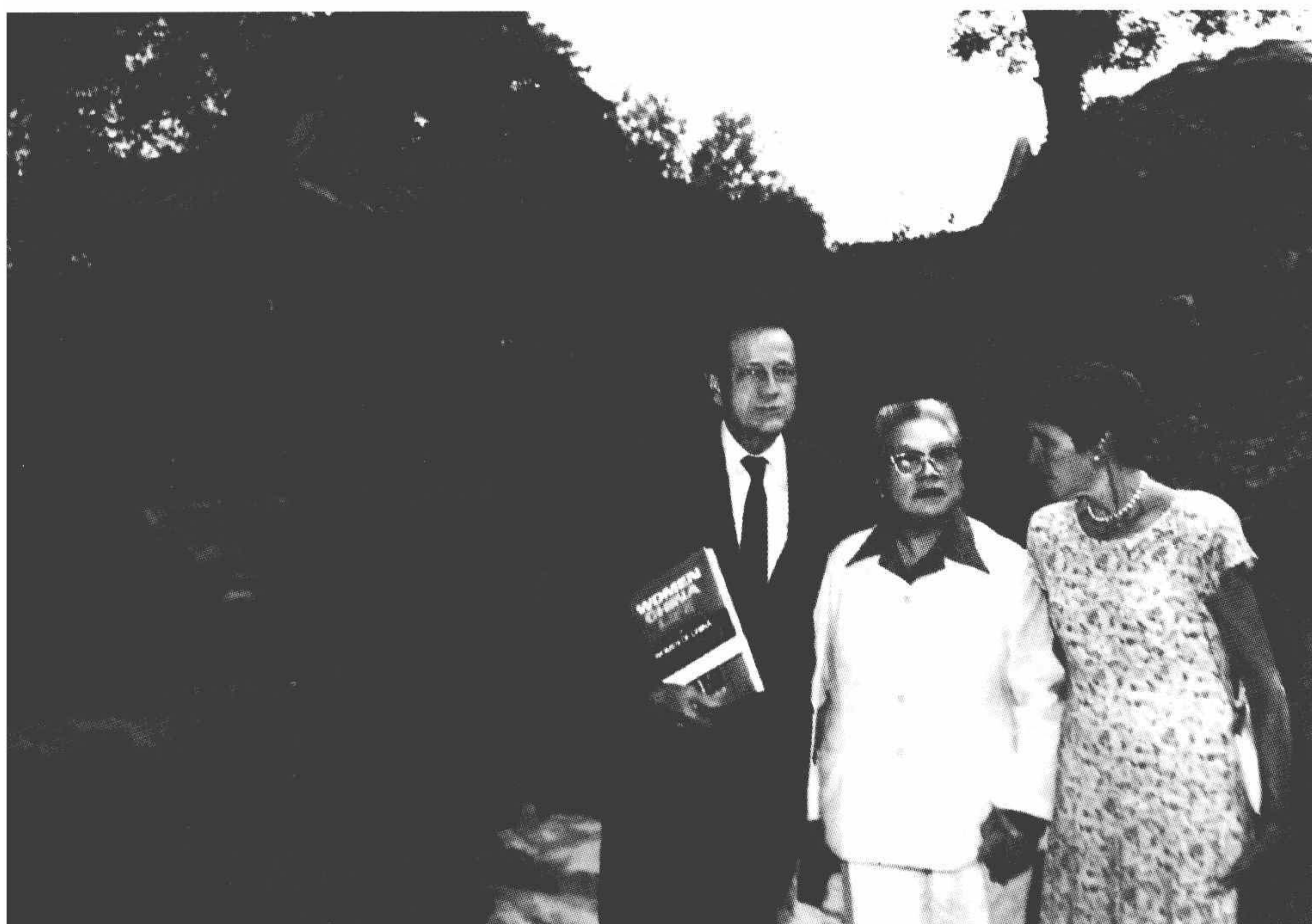
1987年，康克清与联合国儿基会执行主任詹姆斯·格兰特夫妇合影。