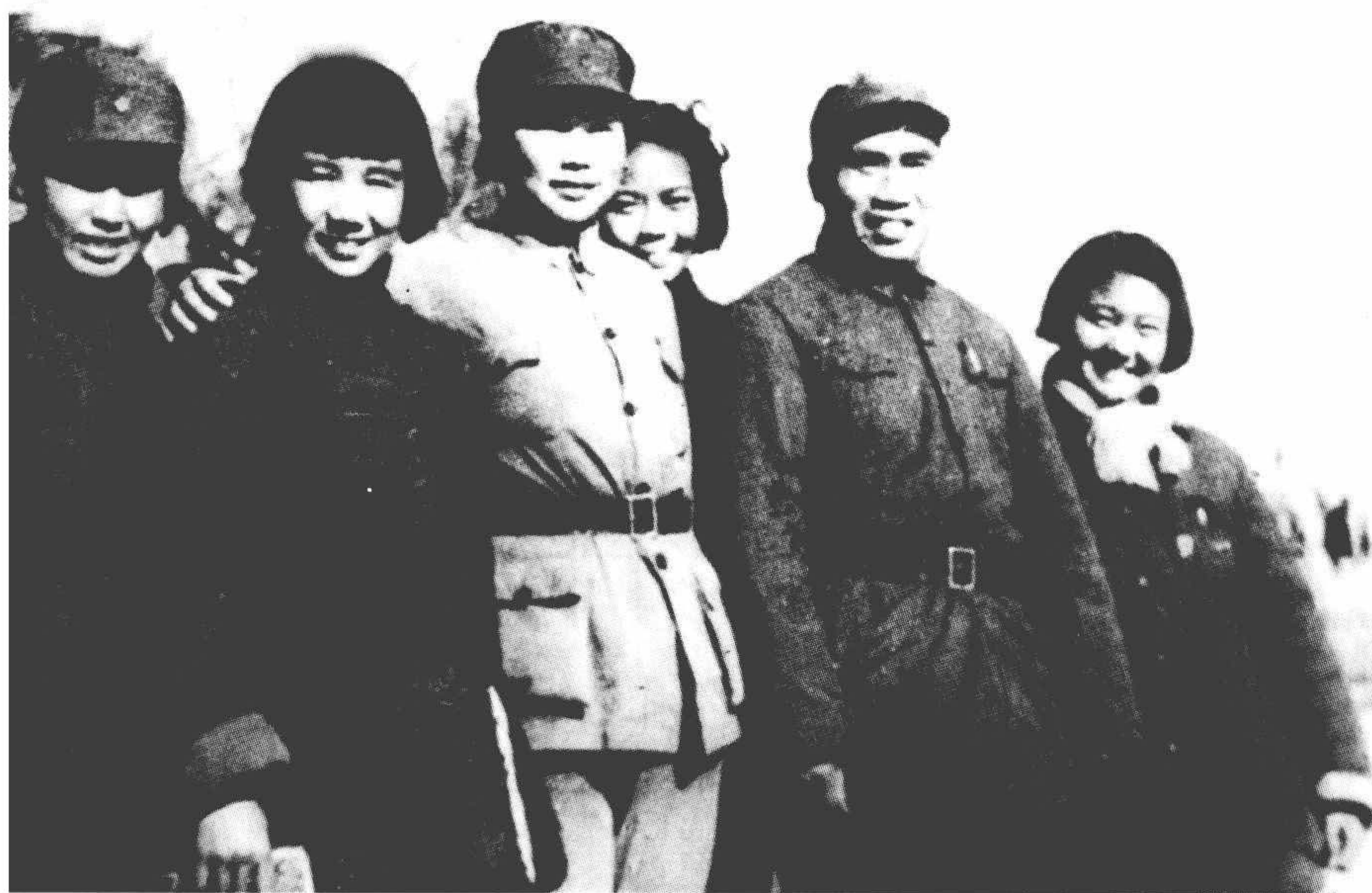
1939年，在晋东南，康克清与朱德和陈波儿（左一）等合影。