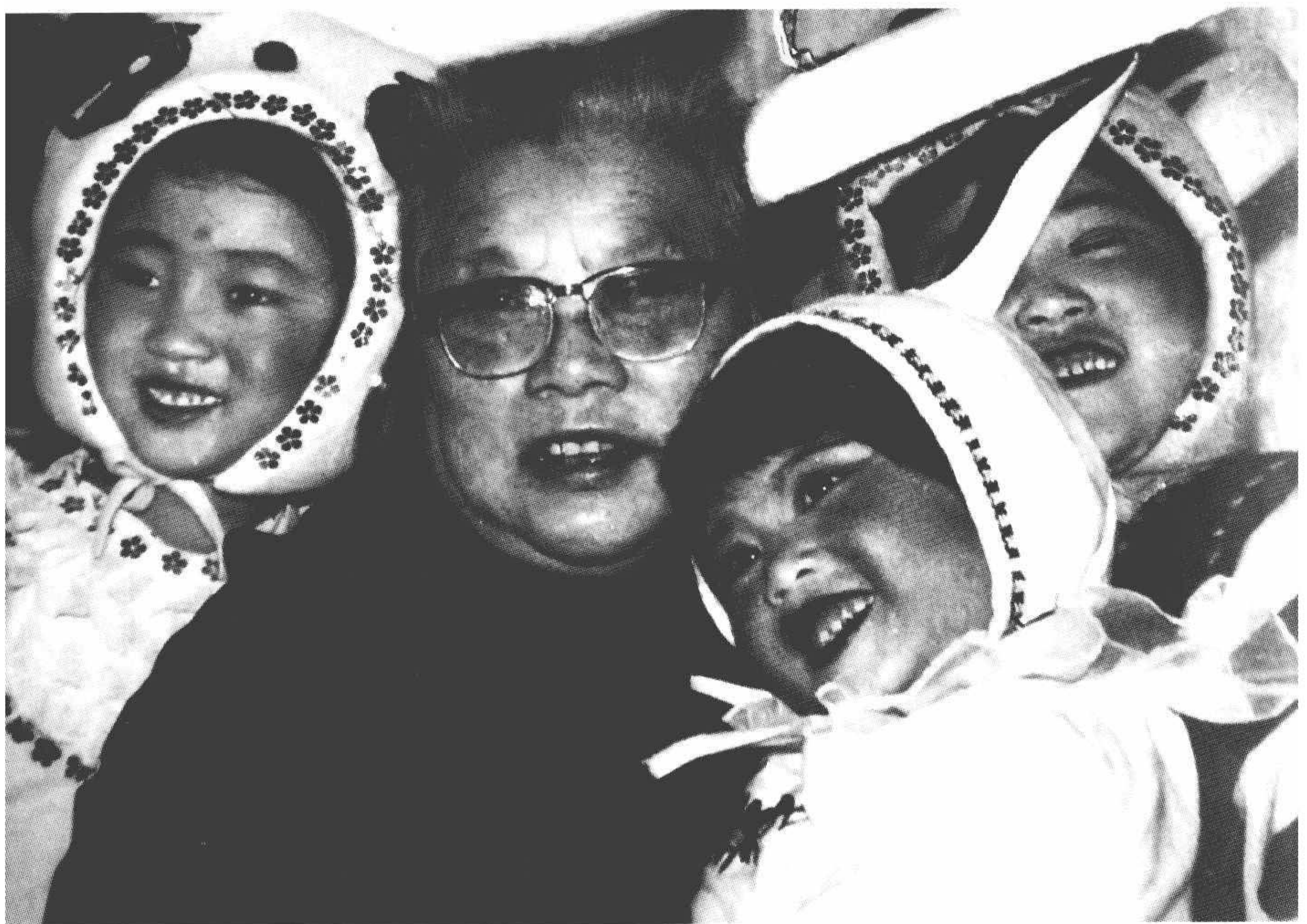
1986年，康克清和孩子们在一起欢度节日。