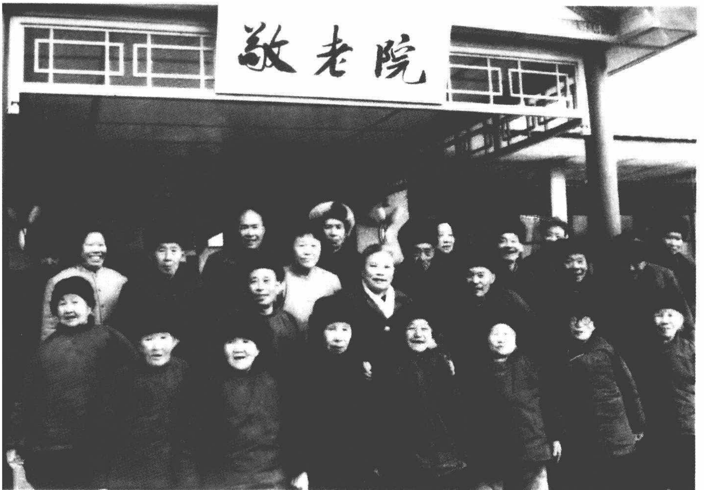
1982年，在四季青敬老院。