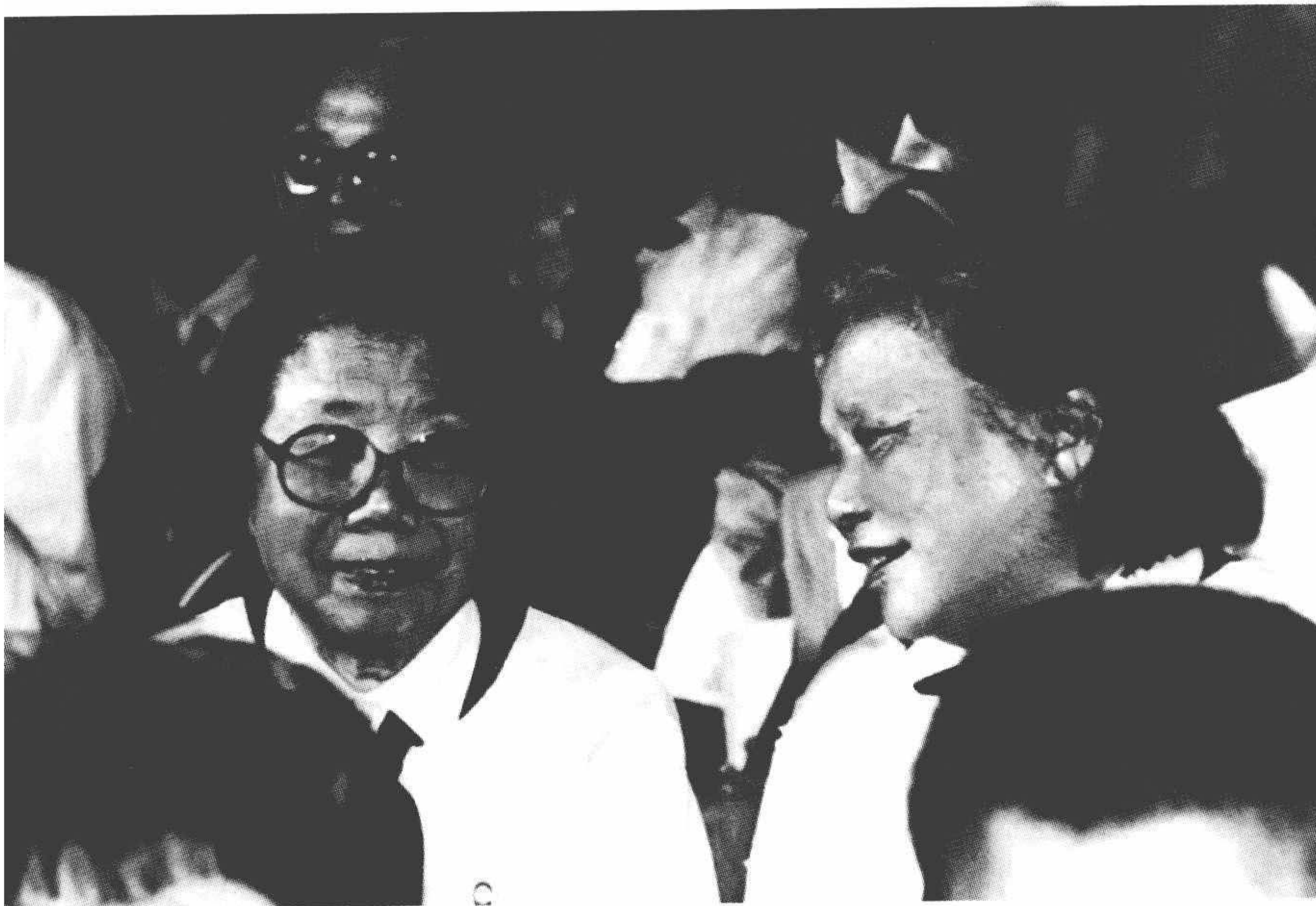
1982年，邓颖超与康克清在儿少活动中心。