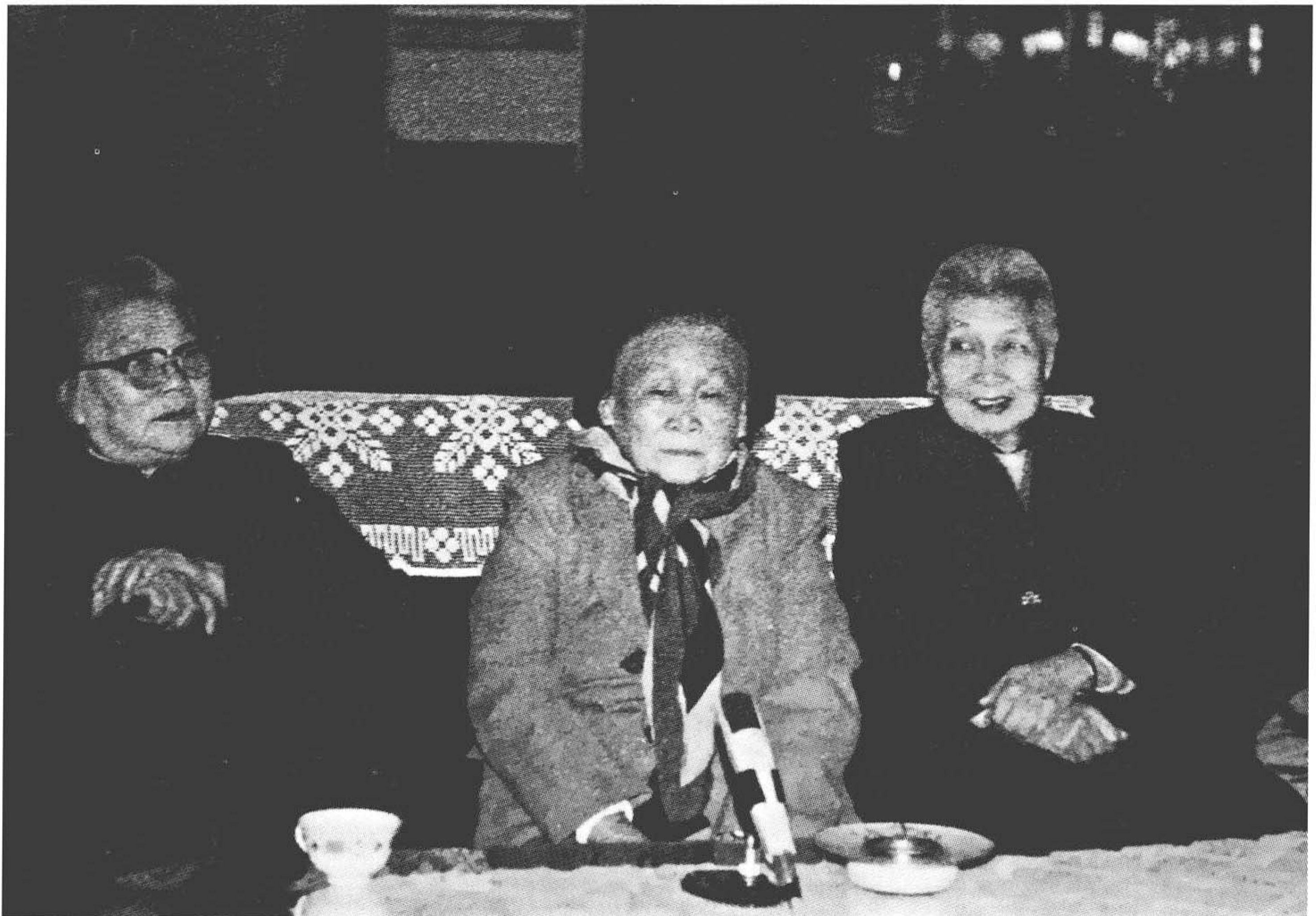
20世纪80年代，康克清与王定国（中）、曾志合影。