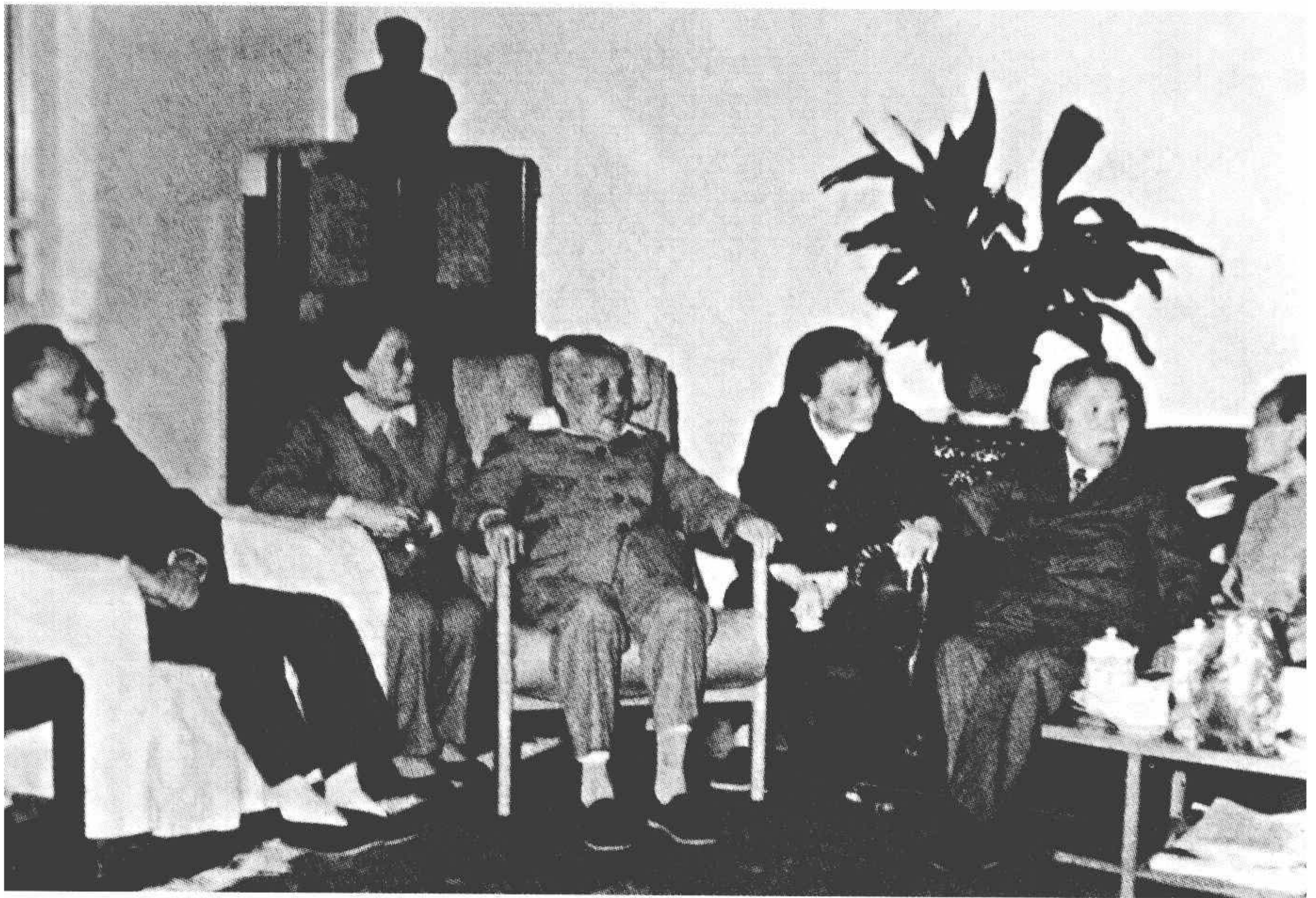
1980年5月14日，与邓小平、卓琳、蔡畅、邓颖超等在一起。