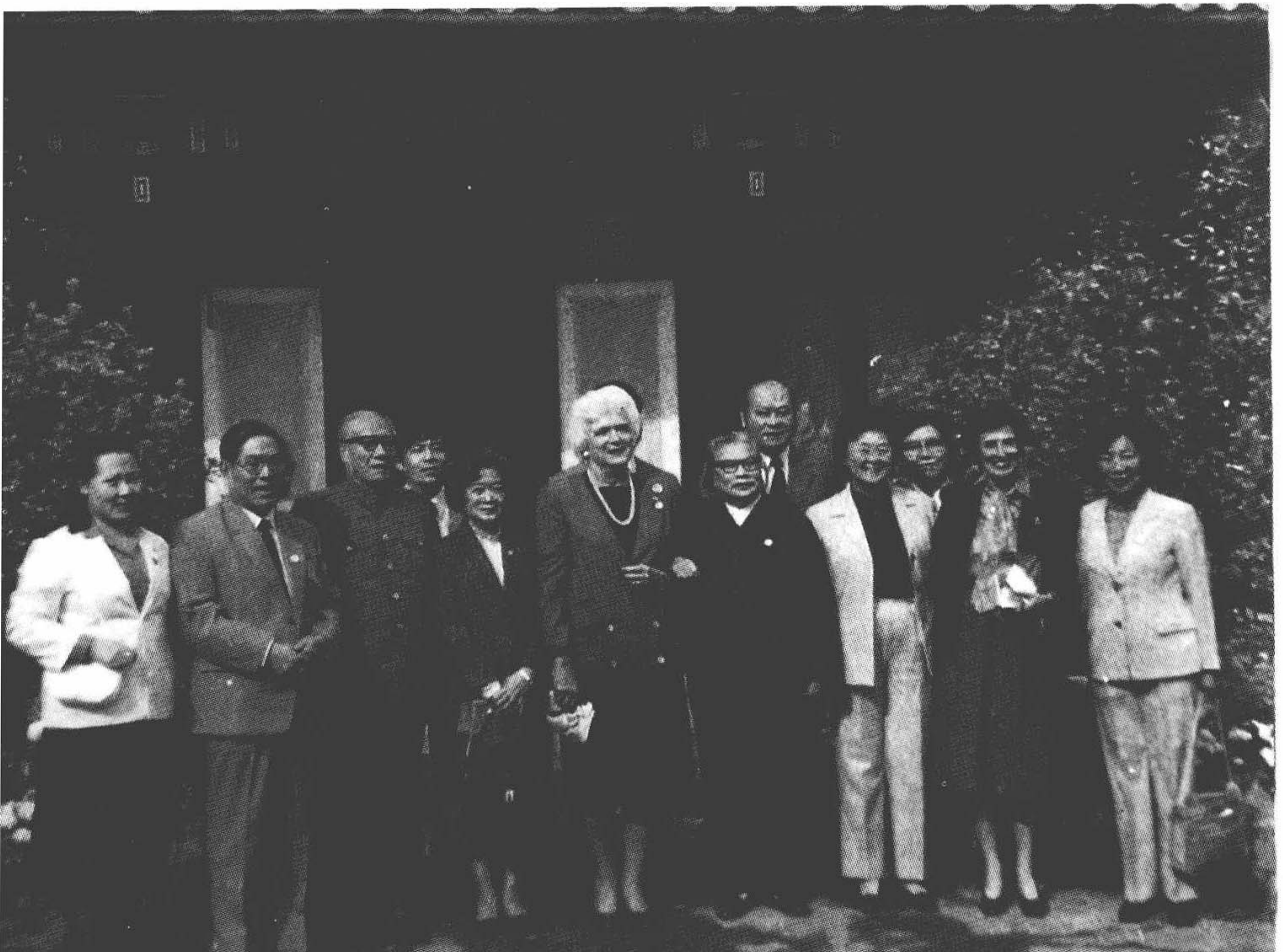
与布什夫人在一起。