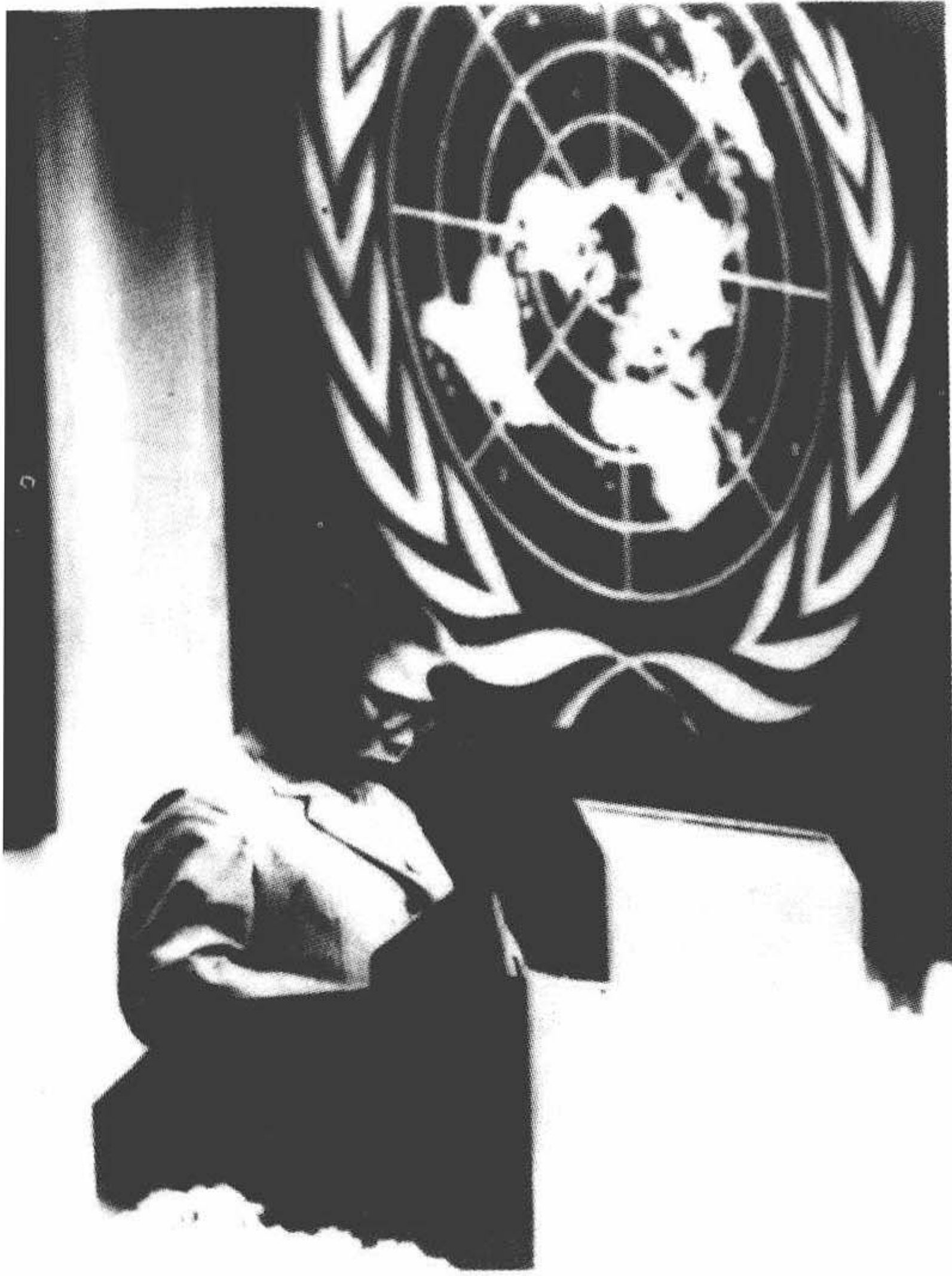
1980年，康克清在哥本哈根“联合国妇女十年”中期会议上讲话。