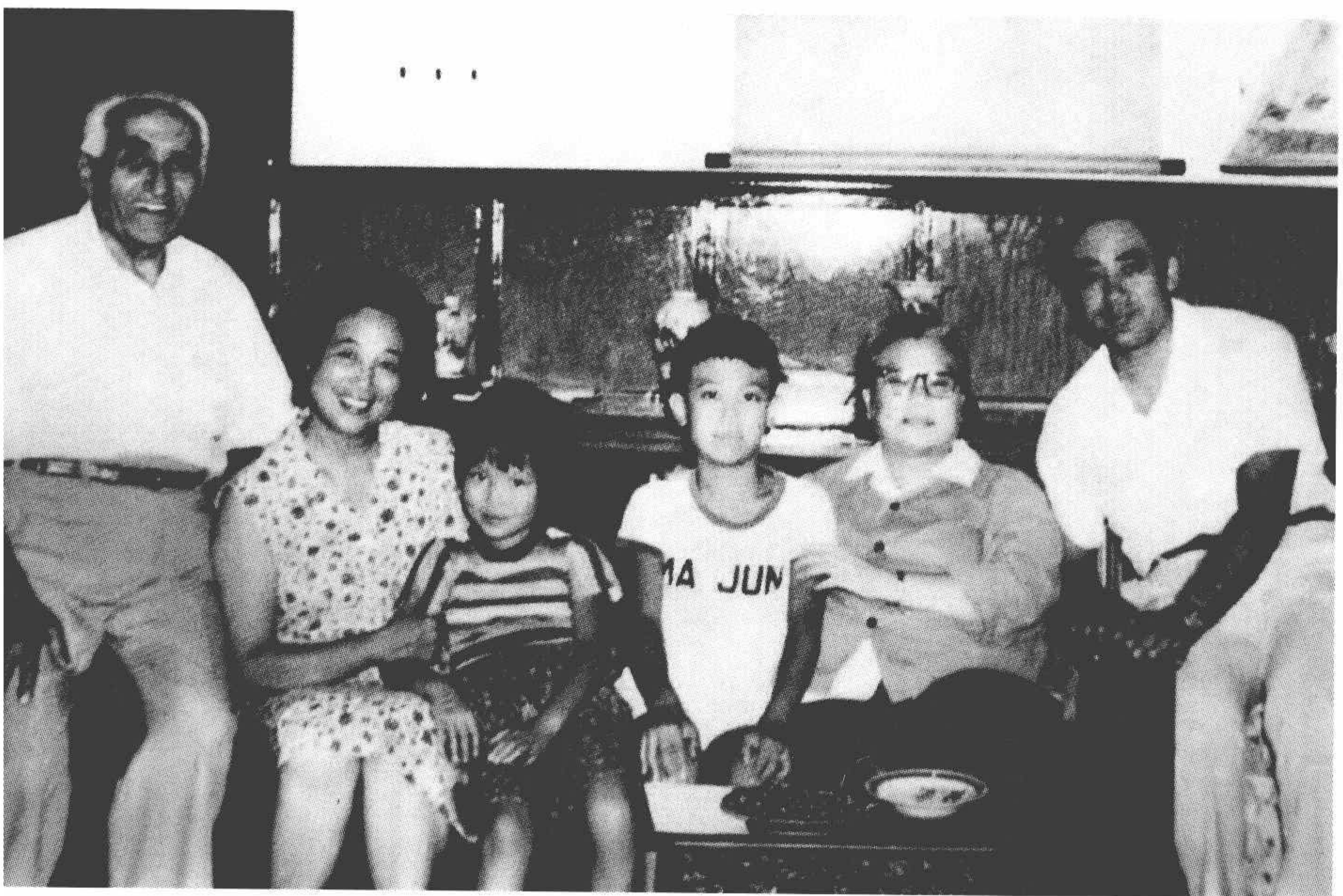
1983年，康克清与马海德一家。