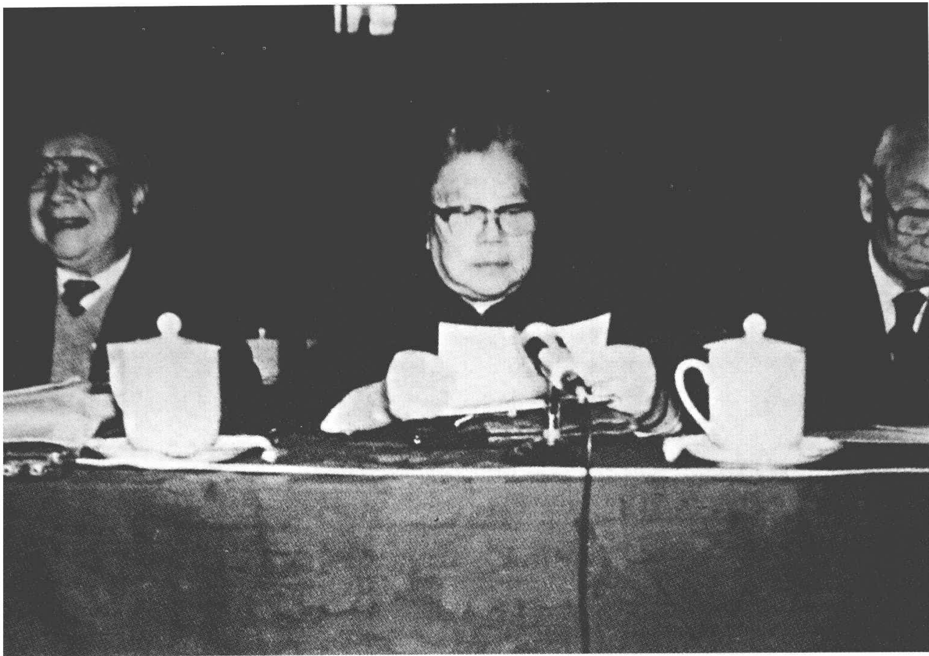
1988年，康克清在全国政协会议上。左为钱伟长。