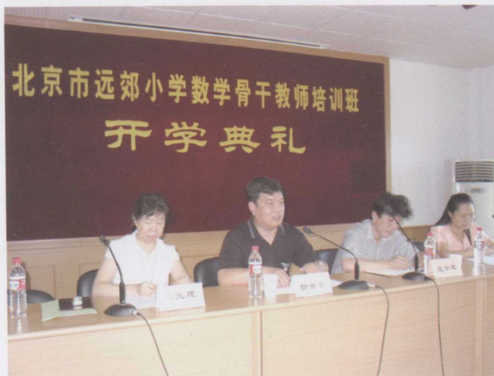
北京市远郊小学数学骨干教师培训班开学典礼