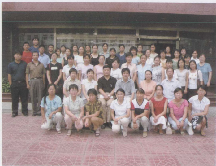
农村骨干班数学 1 班全体合影