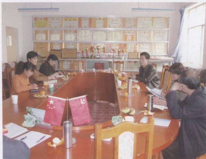
初等教育系教师在基地学校顺义河南村小学与老师们座谈