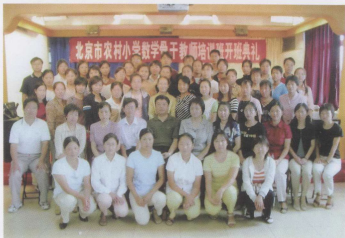
农村骨干班数学 2 班全体合影