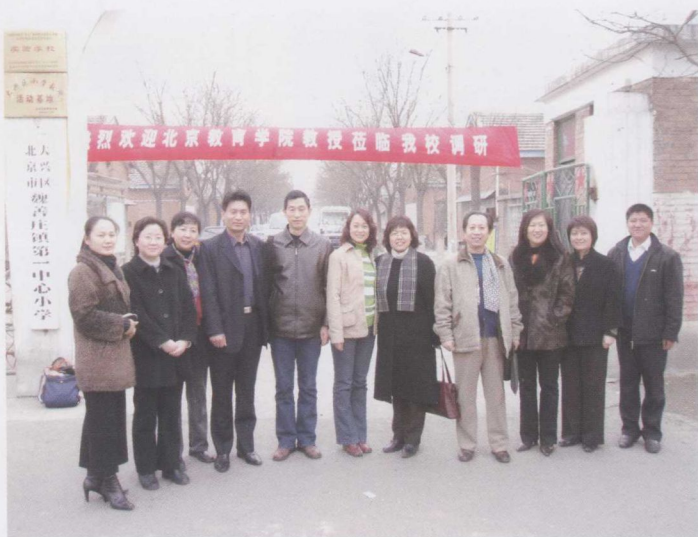
初等教育系到基地学校大兴魏善庄第一中心小学调研