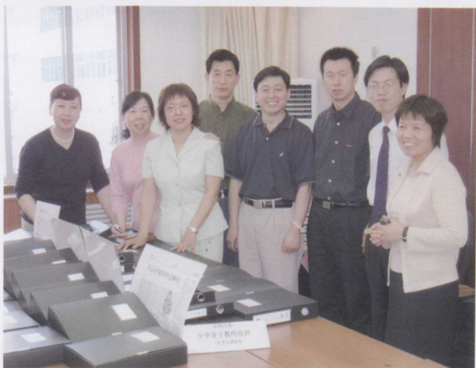
项目团队与领导合影