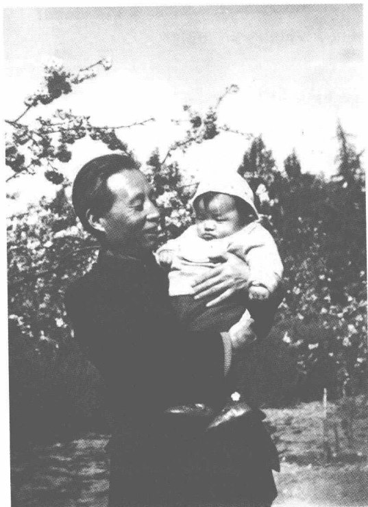
怀抱外孙小忽雷, 1965年摄于云大校园内。