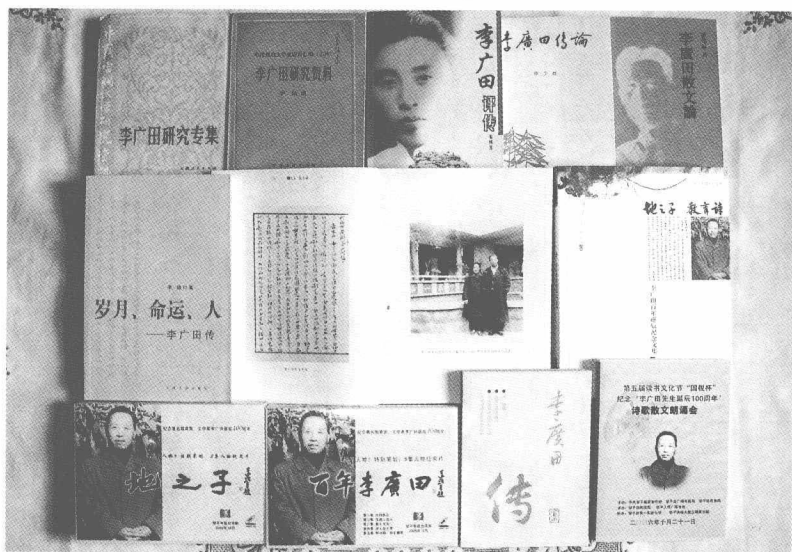
研究李广田作品的资料汇编、研究专集、评传、传论、散文论及各种影象资料。