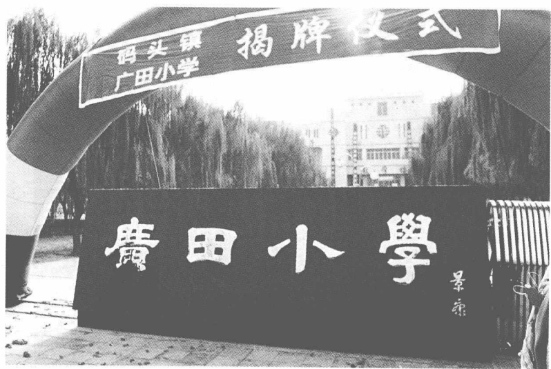
2008年11月，李广田的故乡山东省邹平县码头镇原镇中心小学被命名为广田小学。