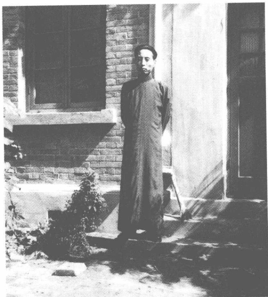
1947年摄于天津南开大学寓所