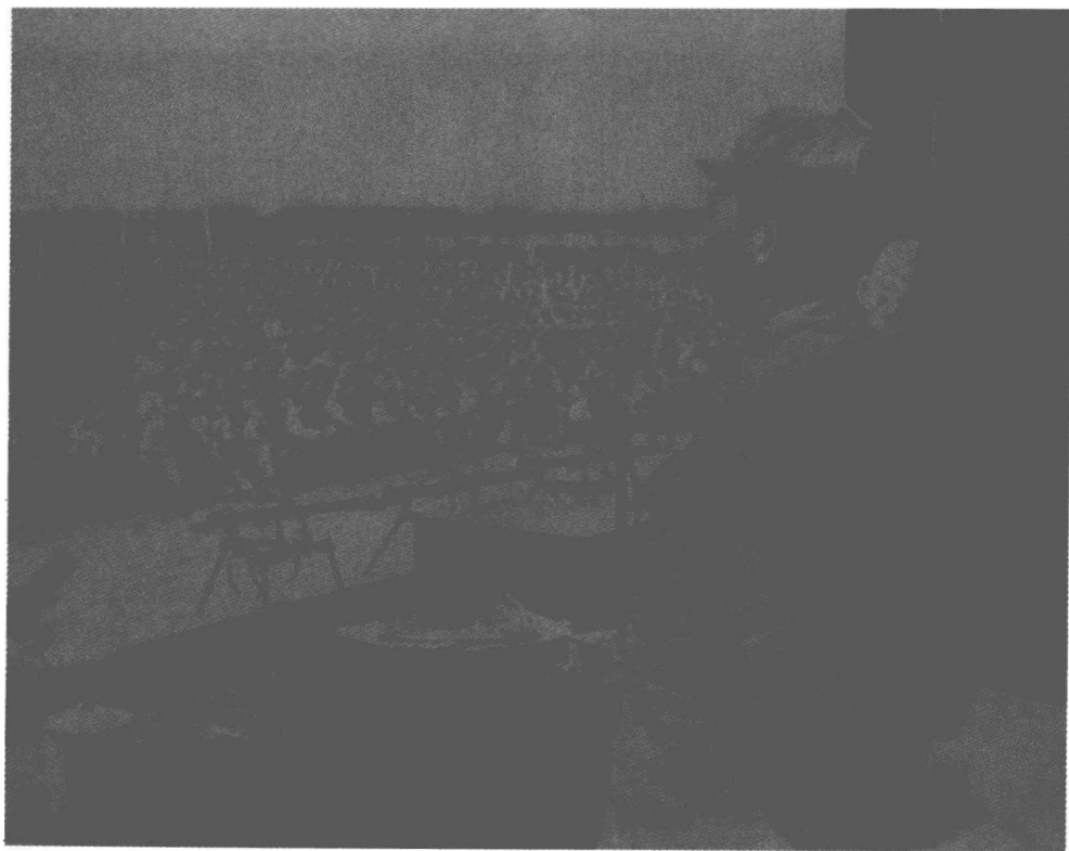
▲秦基伟在45师入朝作战誓师大会上讲话

第45师提出“以阵地为家”的口号,决心把五圣山建成能打、能藏、能生活、能机动的坑道式防御体系。在筑城作业中,战士们琢磨出不少办法,譬如装炸药打炮眼,摸索出了“打斜眼、打水眼、空心装药爆破法”及“深打眼、少装药、紧填塞、放群炮、快排烟”等先进施工方法。为解决炸药不足,战士们在敌人的火力下拉回了许多没有爆炸的炸弹和炮弹,组织专人拆卸,仅45师就拆出炸药三千七百多公斤。