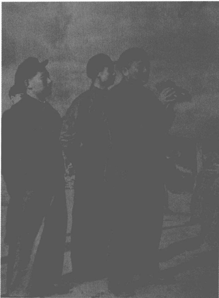
▲1953年7月29日,彭德怀在杜平(左一)陪同下在开城前线视察

老大哥部队很热情,专门派人给我们介绍了经验,其中有很重要的一条是不死守阵地,阵地可以放手让给