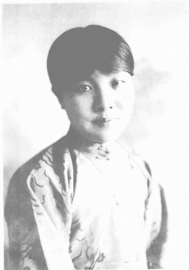
1925年5月10日，冰心在威尔斯利女子大学的草坪上。