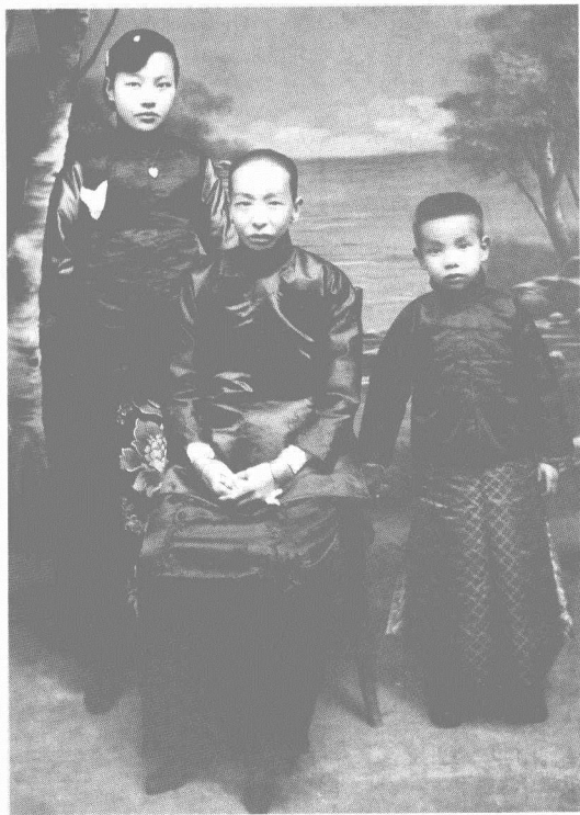
1918年，冰心与母亲杨福慈（1870—1930）、二弟谢为辑在北京。