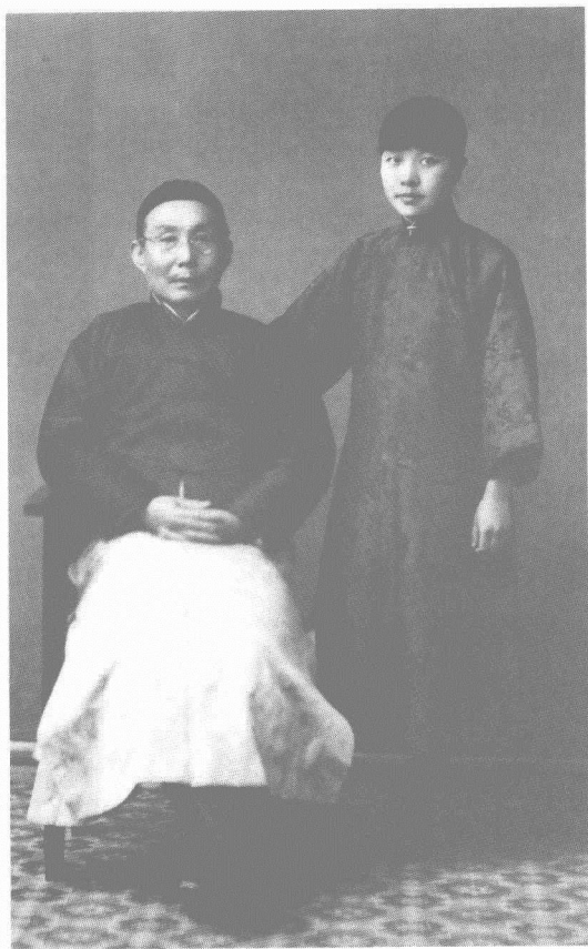
1923年春，冰心与父亲谢葆璋摄于北京。