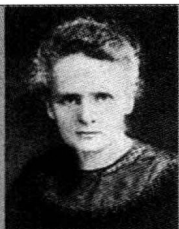
居里夫人 名人档案

居里夫人，原名玛丽·斯克罗多夫斯卡，波兰物理学家，最早荣获诺贝尔奖的女性。居里夫人1867年11月7日出生在波兰华沙市的一个教师家庭。10岁丧母，家境贫困，造就出她吃苦耐劳、好学不倦的品质。1891年，她只身前往法国巴黎大学理学院求学深造。她珍惜其间艰苦而又“完美”的时光，勤奋努力，于1893年获得物理学硕士学位，1894年又获得数学硕士学位。