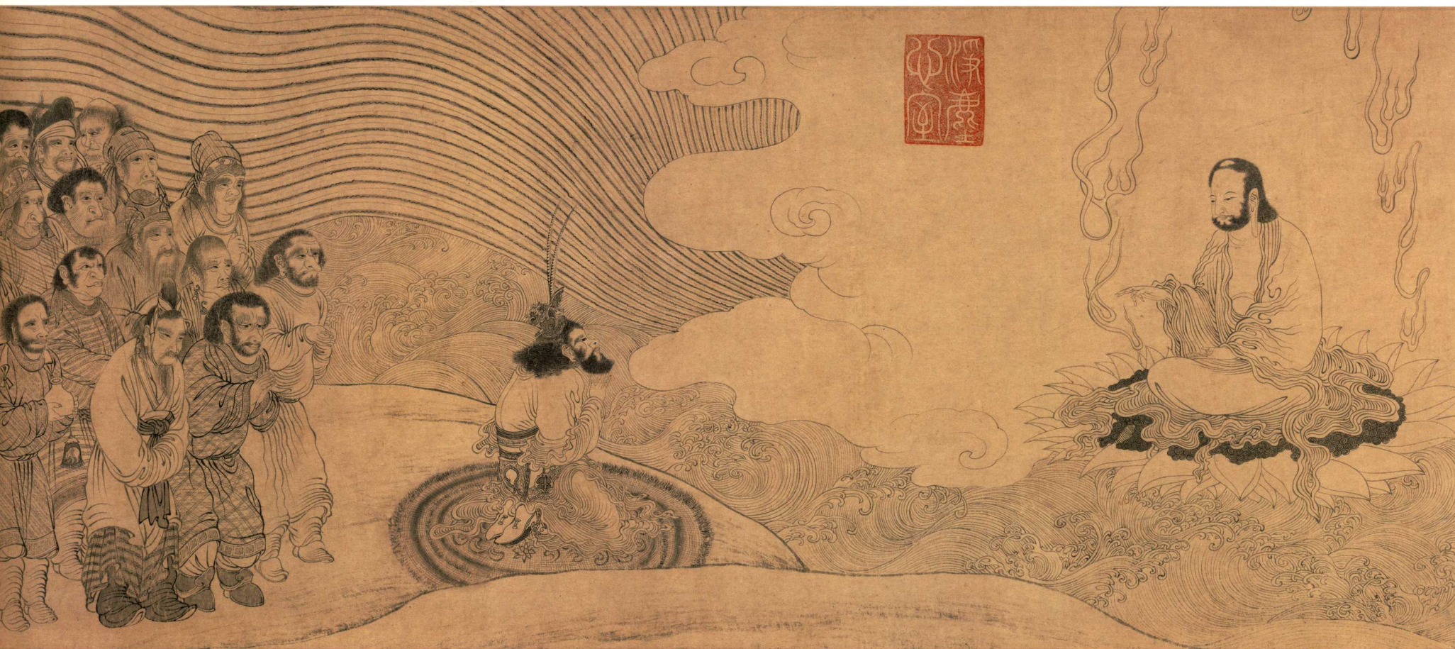
100. 宋 佚名 番王禮佛圖 紙本 水墨 縱34.4厘米 橫131.3厘米 故宮博物院藏

Foreign Kings Worshipping the Buddha Anonymous, Song Dynasty Ink on paper, 34.4 cm × 131.3 cm The Palace Museum