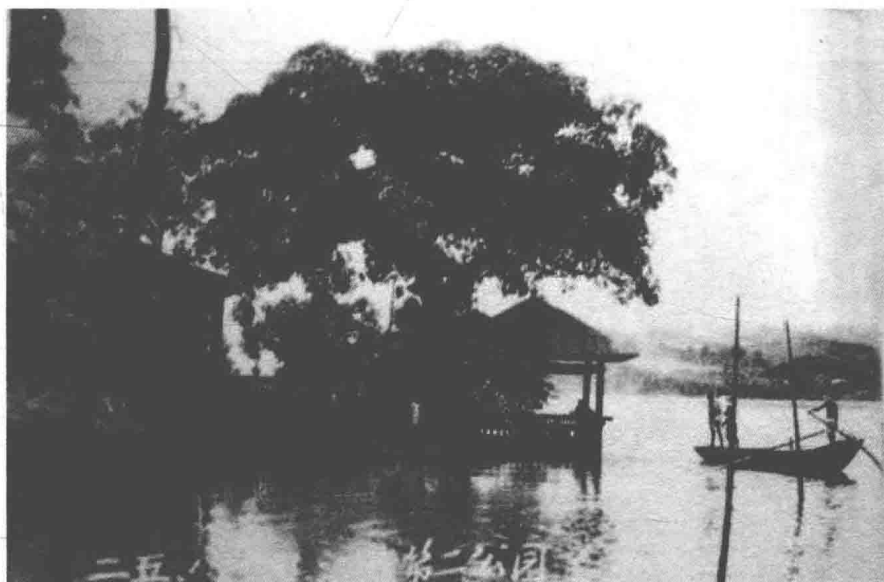
建于抗日战争时期江津县城长江边上的“中苏友谊亭”

县城东门长江边上，一棵老态龙钟的黄葛树，掩映着一座四方亭。这座亭子很特别，亭顶是由银灰色的金属构成。残阳西坠，大江浩渺。在落日