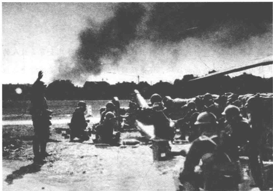
1937年8月13日淞沪会战拉开序幕

人海战术，打得无比英勇顽强，但终因装备低劣，火力不够威猛，面对日军强大的火力，以及钢筋混凝土构建的坚固的工事，束手无策，每争夺一寸土地，都要付出沉重的代价。