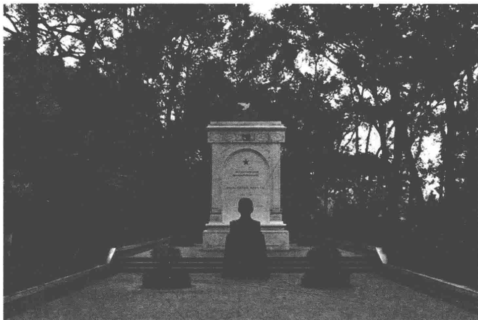
位于重庆市万州区的苏联飞行大队长库里申科少校陵墓和塑像