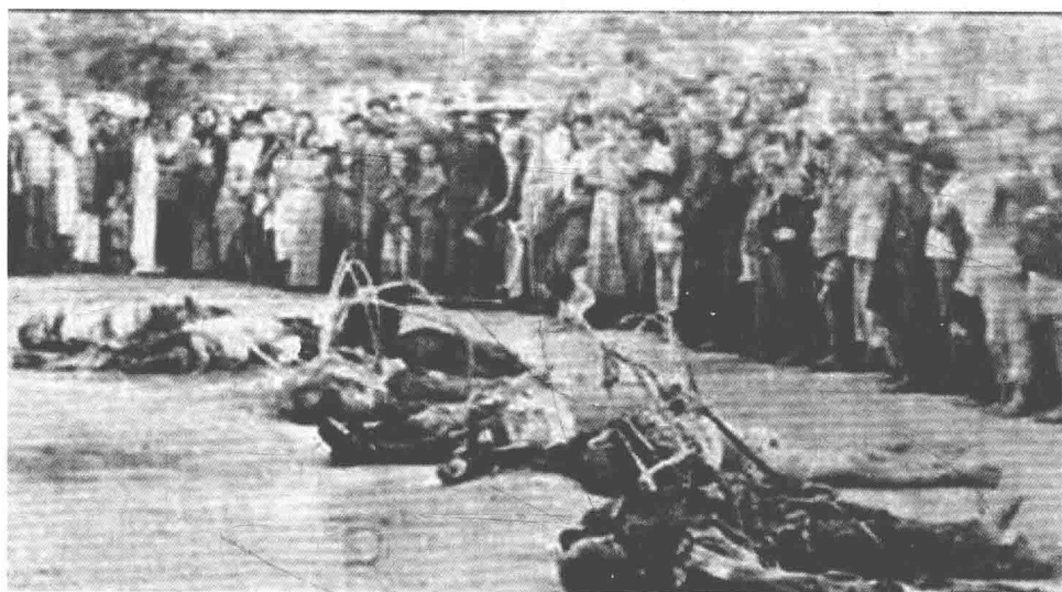
1939年5月25日夜，被苏联空军击落的日寇轰炸机7名飞行人员毙命于江津笋溪河边时的情形。

2011年，作者应中国航空工业集团之邀，撰写《鹰击长空——歼10总设计师宋文骢的传奇人生》一书时，在北京、南京、武汉、重庆、成都等地查阅和收集了大量中国空军发展的史料，却意外地发现，在中国抗日战争期间，最早给中国提供军事援助，帮助中国人民抗击日本空中强盗的，却是英勇的苏联空军！