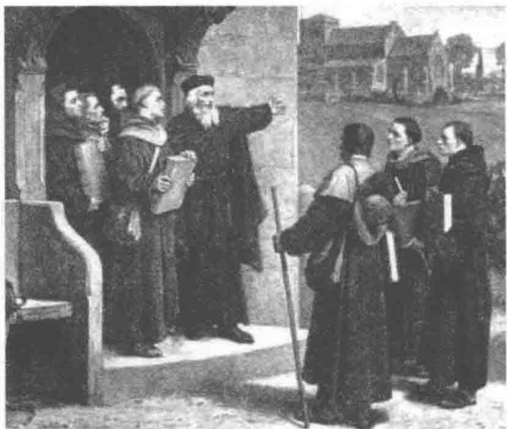
17世纪的英国清教徒

自16世纪上半叶开始的宗教改革运动席卷了整个欧洲大地，德国的马丁·路德、法国的加尔文成为改教后基督教新教的领袖。在当时的英国，由于英国国教的专横，宗教改革姗姗来迟，但英国教徒们还是受到了来自加尔文教义的影响。1524年，英国人丁道尔把《新约·圣经》翻译成英文，