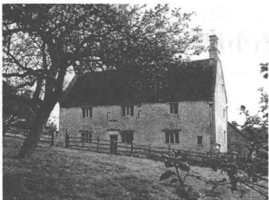
牛顿出生地艾尔斯索普庄园