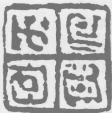
图 3- 子巨□□

众所周知，元、明、清印家畅谈“印宗秦汉”，却对所谓“秦”的认识是模糊的。清人又将印章史称之为两个高峰期，即：秦汉印时期和明清流派印时期。此等定位尚有道理，但迷离含糊，这与对先秦古玺认识缺失有关。因为当时的见闻与所研究的对象相对狭窄，对秦与秦以前的古玺、古文字等领域尚处于初级研究阶段，故而朦胧地将秦汉印捉置一处，混为一谈（这里所说的高峰是在具体时间段内产生的，有鲜明风格取向，相比而言，且最有艺术特色和最有学术价值的印风）。及至清末民国时期罗振玉、王国维等先生的不菲研究，秦汉之分才渐渐地分化开来。在信息高度发达的当代社会，随着愈来愈多的玺印、钟鼎、简帛等器物的不断出土，人们对古文字与先秦古玺更深层次的研究，以及对先秦玺印的重新理性认识，俗称印章史的两个高峰期也逐渐地被细化。也就有了今天大多数印家认同的三座高峰期，即：先秦古玺时期，秦汉印时期，明清流派印时期。