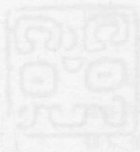
图 1- 瞿甲