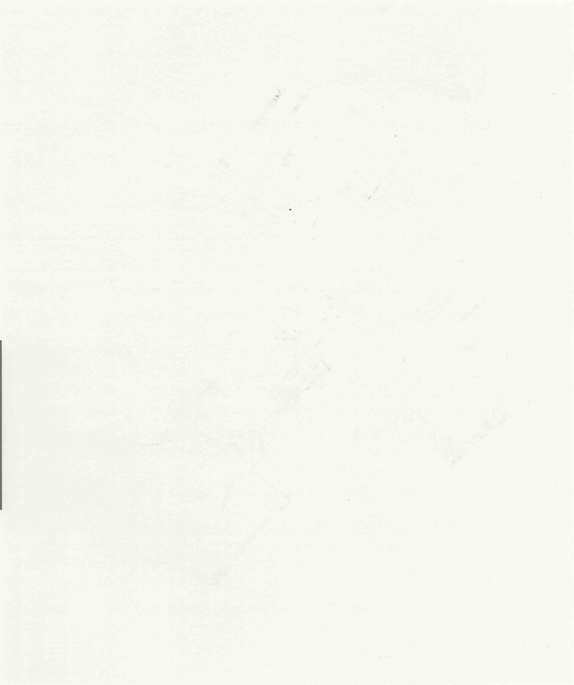
Figure 1 Map of the study area Scale: 1:50,000 Date: 2000