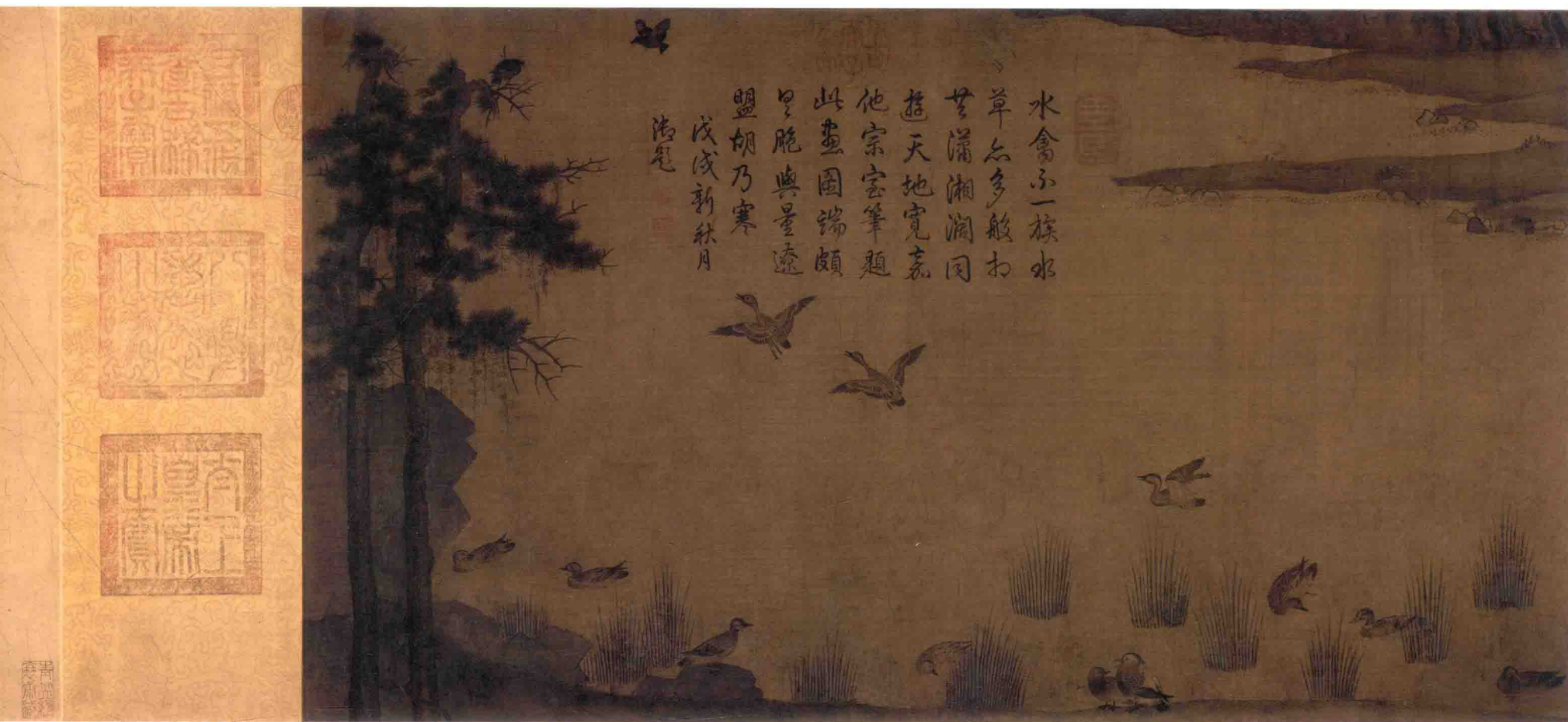
19. 宋 趙士雷 湘鄉小景圖 絹本 設色 縱43.2厘米 橫231.5厘米 故宮博物院藏

Scene of Xiang River Zhao Shilei, Song Dynasty Ink and color on silk, 43.2 cm × 231.5 cm The Palace Museum