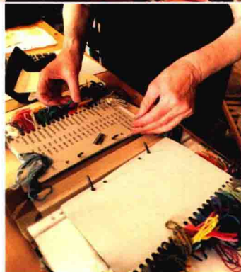
上/只经营国产线的安妮与积极地支持着她的丈夫 下/每一种颜色的线都很漂亮,里面也有日式风格的段染线

斯德哥尔摩的老城格拉斯坦很小,只需一小时,就能逛上一圈,很有中世纪的氛围,来自世界各地的游客,都会为那里所展现出来的北欧魅力所着迷。