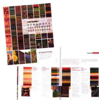
上/将旧的饼干盒设计成了花片 下/通过众筹的方式筹集资金而出版的书 www.knitsonik.bigcartel.com www.felicityford.co.uk

2014年,一本名为《KNITSONIK STRANDED COLOURWORK SOURCEBOOK》的书出版了。作者是艺术家兼设计师费利西蒂·福特。费利西蒂参考她现在住的雷丁的街道设计花样,用幽默、简洁的语言讲解了怎样将自己喜欢的身边的东西分解、再构建,最终设计成配色花样的方法。