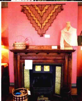
上/由维多利亚时代的公馆改装而成,成立于1997年 下/创意编织展与壁炉、豪华的吊灯和地毯都融为了一体

位于华盛顿州西部的港口城市拉康纳,从西雅图向北开车大约一个半小时就能够到达。拼布和纺织品博物馆,位于时装商店林立的商业街尽头。维多利亚时代的大公馆里豪华的装修和漂亮的家具,都犹如博物馆的展品一般。