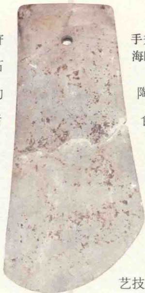
手斧形器，新石器时代，广东省佛山市南海区西樵山遗址出土，广东省博物馆藏。

稍后，火的利用彻底改变了人类的生活，使人们能够在寒冷的冬季和夜晚活动，给人们的生产和生活带来极大便利。随着人类社会从旧石器时代过渡到新石器时代，人类的生产方式也由原始采集和狩猎向原始农业过渡。农耕作业的收获使人们过上了相对稳定的生活，于是，“神农耕而作陶” ① ，产生了制陶的工艺技术。各种形制不同、大小不一的