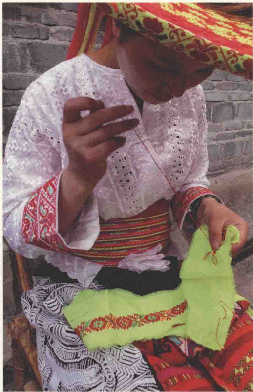
最简单的工具——针，在挑花时创作的自由度最大。图为瑶族妇女在挑花。

自然界是人类生存、生活的基础。在人类历史之初，人们从自然中获取大量的物质资料作为生活之需。人们通过观察种种有趣的自然现象，学会了利用天然的工具对自然物进行加工改造。已经学会思考的人们，在