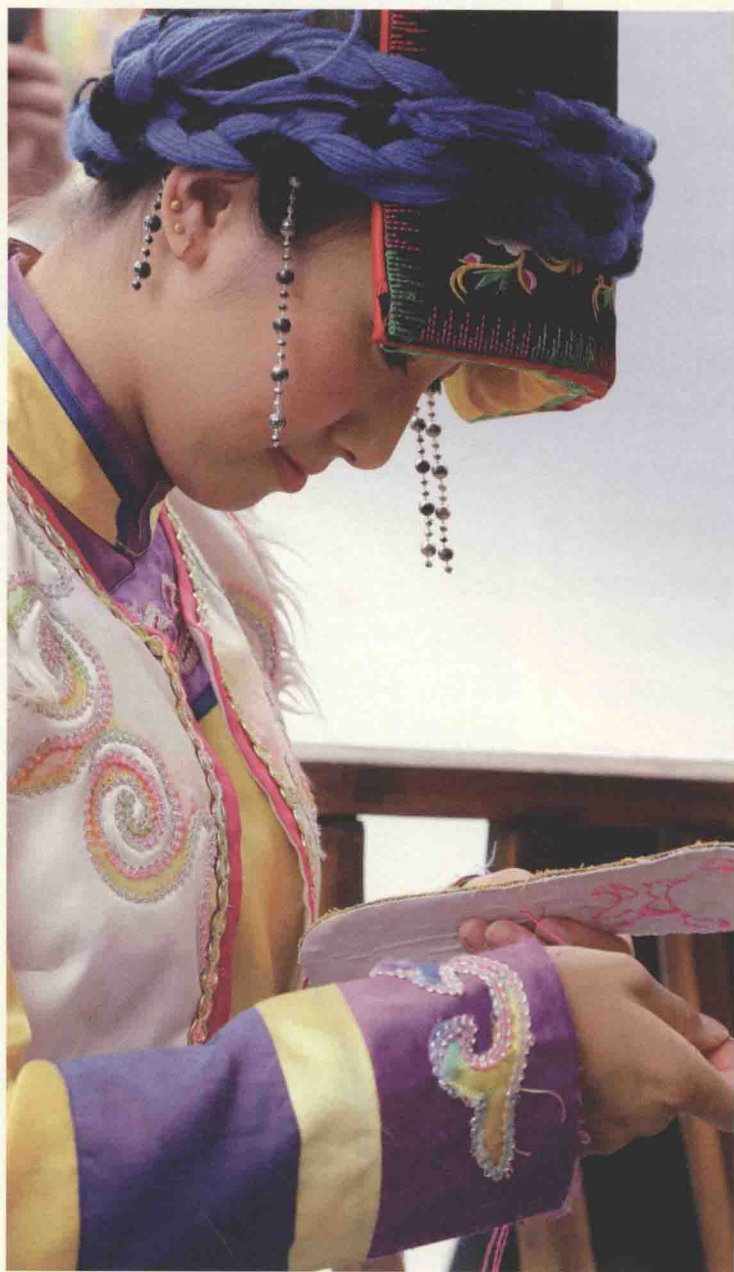
羌族姑娘在刺绣鞋垫，图片摄于四川省汶川县映秀镇。

代表着手工艺所有行当的“百工”，对封建社会的发展做出了巨大的贡献，就连统治者也认为“来百工，则财用足” ① 。封建社会的官营手工艺产业与民间的私营手工艺产业互为补充。不同身份的手工艺人凭借其精湛的技艺，通过专业的分工合作，制造出门类众多、质量上乘的产品，基本能够满足社会各阶层的不同需要。