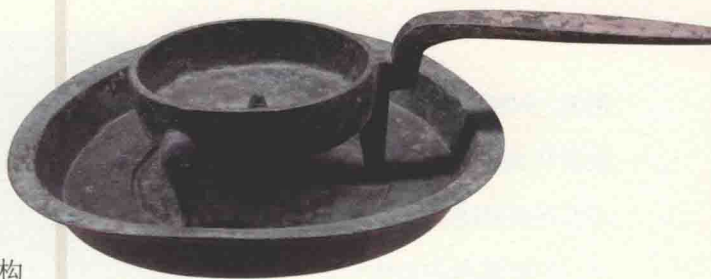
拈灯，汉，陕西省西安市博物院藏。

秦汉（前221—220）时期，中国进入了封建社会的发展阶段，社会生产力的水平有了显著提高。社会生产力和科学技术的进步，也促进了手工艺产业的大发展，手工艺行业的分工更加专门化。有竹器业、铜器业、素木器业、漆木器业、毡席业、造船业、制车业、制漆业、丹砂业、草药加工业、丧葬品加工业、珠宝业、金器业、玉器业等，“皆中国人民所喜好，谣俗被服、饮食、奉生、送死之具也” ① 。无论是产品的品种数量，还是制作的