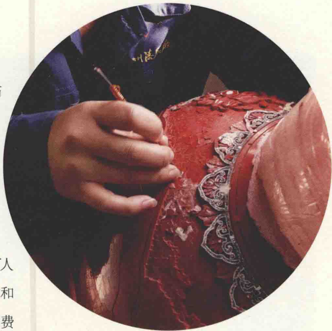
雕漆工艺。艺人操作简单工具雕刻出复杂的纹样。

“凡天下群百工，轮车鞮鞞，陶冶梓匠，使各从事其所能” ② ；“史为书，瞽为诗，工颂箴