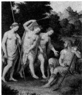
▲图 1-8 帕里斯的裁判 (16th century, Civic Museum, Udine, Italy)

还不是王子，权力、荣誉对他来说都无所谓，他真正渴望的是女人，真能打动他的就是女人。而且他是一个翩翩美少年，天生的情种和调情高手，阿佛罗狄忒的话深深地打动了他。仔细端详三位女神：赫拉女神雍容华贵、端庄秀美，但是太高傲；雅典娜女神英姿飒爽、冷艳逼人，可是太冷峻；只有阿佛罗狄忒女神仪态万方、风情无限，一顾倾人城，再顾倾人国。这样的美貌打动了帕里斯，他把金苹果放在了美神阿佛罗狄忒的手上，另外两位女神见状羞愤难当，拂袖而去。这就是所谓希腊神话中著名的“帕里斯的裁判”。