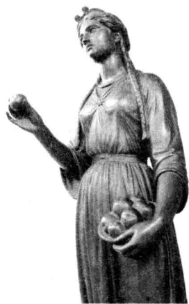
▲ 图 1-9 北欧神话中看守金苹果园的伊顿女神（Herman Wilhelm Bissen, 1858）

可以肯定，这个神话是世界上有关选美比赛的最早记载，而这种选美比赛在古希腊是司空见惯的。古希腊