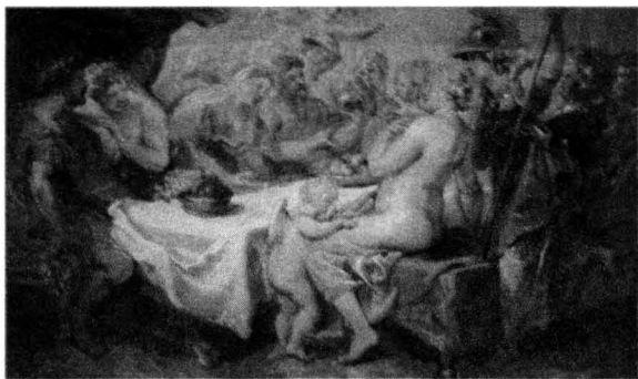
图 1-6 女神们为争夺金苹果而 ▼ 争吵 (Peter Paul Rubens, 1636)

宙斯为难了。俗话说“清官难断家务事”，面对妻子和两个爱女，把金苹果判给谁都不合适，都会引起家庭纠纷。（图 1-6）作为大家长，宙斯可不愿意得罪这些家庭成员，他灵机一动，说：你们不要让我来裁决，我给你们推荐伊达山牧场上的牧羊人，他叫帕里斯，很有审美品位。宙斯这一招真是老谋深算啊！既转嫁了矛盾，又设下了特洛伊战争爆发的伏笔。