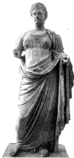
▲图 1-3 忒弥斯女神 (National Museum of Archaeology, Athens)