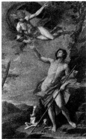
▲ 图 1-7 神使赫尔墨斯请牧羊人帕里斯裁判金苹果的归属 (Donato Creti, 1745)

一支火炬，把特洛伊城烧为灰烬。先知预言说这个孩子是个灾星，将来会给国家臣民带来灾祸。所以普里阿姆就让仆人阿格劳斯把婴儿儿抛弃到伊达山上。可是这个孩子大难不死，竟然被一头母熊哺育。五天以后，阿格劳斯重访弃子之地，发现这个孩子很健康。他认为这个孩子一定有神灵保佑，将来必成大器，所以就收养了这个弃婴。帕里斯长成了一个非常俊美的青年，在伊达山给养父放羊，后来被一个痴情的仙女奥伊诺奈爱上了，同他结为伉俪，过着田园牧歌式的生活。这天，帕里斯正在放羊，突然神使赫尔墨斯降临，通知他三位女神要他充当仲裁。这让牧羊少年诚惶诚恐。（图 1-7）三位女神驾着祥云降临到他面前，各个美艳绝伦，光彩照人，帕里斯越看越没主意。三位女神为了自己的荣誉，也顾不上体面和尊严了，使出各种手段贿赂这位评委。赫拉女神做出许诺说：年轻人你要是把金苹果判给我，我让你做世界之主，人世间伟大的统治者。这个许诺，对有政治野心权力欲的人来说，蛮有诱惑力的。雅典娜女神说：你要是把金苹果判给我，我让你做世界上最伟大的武士和征服者，赢得不朽荣誉。按照“英雄时代”的价值取向，建功立业、博取荣名是武士们梦寐以求的追求，他们甚至把荣誉看得胜过了生命，所以这个许诺对武士是很有吸引力的。可是爱神阿佛罗狄忒的许诺切中了男人的要害，她的杀手锏就是女人。阿佛罗狄忒许诺说：如果你把金苹果判给我，我让你得到全希腊最美丽的女人！她就是宙斯的女儿、斯巴达的王后海伦，虽然海伦已经有夫之妇，但是我仍然可以把她送到你的婚床上！（图 1-8）这位女神的许诺让牧羊少年怦然心动。帕里斯当时