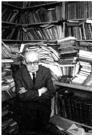
图 1-11 法国比较语言学家和神话学家乔治·杜木吉尔 ▼(George Dumézil, 1898-1986)

阿佛罗狄忒女神的美貌打动了帕里斯，她的承诺也正对他的胃口，于是赢得了金苹果。下面该轮到阿佛罗狄忒履行诺言了。女神究竟怎样履行她的诺言呢？那位“全希腊最美丽的女人”海伦究竟是何许人呢？阿佛罗狄忒怎样把她同帕里斯撮合在一起的呢？我下次再讲。