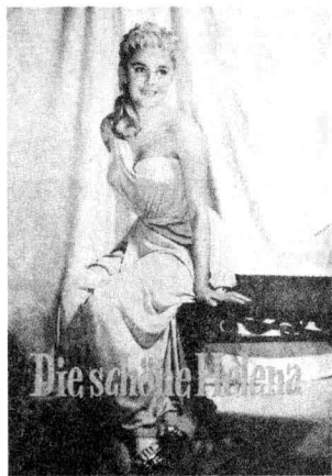
▲图 1-1 1956 年意大利影片《特洛伊的海伦》(或译《木马屠城记》)的海报,剧中女主人公海伦的扮演者为意大利女星罗萨娜·波德斯塔

在今天节目中,我将把大家领入希腊神话中一个引人入胜的领域,这就是脍炙人口的特洛伊战争故事。特洛伊战争是古希腊神话的一个重要组成部分,对西方文化有重要的影响。粗略统计一下,自上世纪以来,关于特洛伊战争主题的电影作品,拍过将近 20 部,相关题材的电视节目更多,足见该故事在西方世界的持久影响力。(图 1-1) 2004 年在全世界放映的好莱坞大片《特洛伊》轰动一时,吸引了很多观众的眼球。但是,电影毕竟是一个改编的、浓缩的艺术,它和故事的原貌相差甚远。那么,《荷马史诗》中描述的特洛伊战争的原貌是怎样的呢?在希腊神话中,特洛伊战争是古希腊人发动的对小亚细亚地区西北部特洛伊城的军事远征,持续了十载,耗费了大量的人力、物力和财力,让无数将士血染沙场,魂归幽暗的哈德斯冥府。