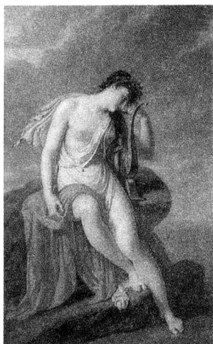
▲图 1-10 女诗人萨福 (Pierre Narcisse Guérin, 1880s)

人以爱美著称，他们不仅举办男子选美比赛，也举办女子选美比赛。据史料记载，雅典的泛雅典娜节赛会上就有这种男子选美比赛（euandria），由各部落组队参赛，比的是男性身体的阳刚之美，类似今日之健美赛。参赛者不仅要求体形匀称健美，还要面貌英俊。优胜者将作为最俊美的男人荣幸地成为节日游行队伍中持圣物礼器的一员。女子选美也确有所闻，公元前 6 世纪，女诗人萨福（图 1-10）的家乡莱斯博斯岛就曾举办过女子选美赛。据诗人阿尔克曼讲，岛上的漂亮姑娘穿着曳尾裙，在裁判面前展现优美体形，周围不时响起妇女们的喧哗和叫好声。古典作家雅典尼乌斯的《博学的盛宴》也曾记载：科林斯僭主库普赛洛斯在纪念德墨忒耳女神的节日庆典上举办选美赛，而且在首届比赛上，他的妻子赫罗狄刻还赢得了优胜奖。雅典尼乌斯还说，在选美比赛中脱颖而出，靠的是幸运和天生丽质，还有节制，保持节制的美才是值得夸耀的，否则就难免失之于放荡。他还提到伊利斯地区的选美活动，优胜者享受的殊荣就是在纪念赫拉女神的祭礼中履行神圣的职责：冠军为女神持器皿，亚军为女神牵牛，季军负责把祭品首先投入祭坛的火中。看来，选美比赛的源头在古希腊，反映在神话中就是帕里斯裁判的故事。选手们行贿裁判也不是空穴来风，可能也有真实生活的素材。看来，比赛行贿评委的做法，自古始然，这根子可以追溯到希腊神话故事中。总之，我们欠古希腊人很多东西。我曾经在一本书的绪言中讲过：“如果在渺远的古代寻觅与现代人生活理念最贴近、最意趣相投的民族，就非古希腊人莫属了。我们应该怀