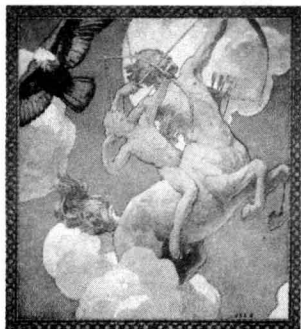
图 1-4 马人喀戎 (John ▼ Singer Sargent, 1921)

尔科斯国王阿卡斯托斯，后者为他洗去血罪。由于珀琉斯长相英俊，一表人材，阿卡斯托斯的妻子，伊奥尔科斯的王后阿斯图达美亚偷偷爱上了这位英雄。她总是寻找机会向他暗送秋波，表达爱意，但珀琉斯是个正人君子，坚守朋友之妻不可欺的原则，毅然回绝了轻浮的王后。王后恼羞成怒，由爱转恨，想方设法报复珀琉斯。她首先派人给珀琉斯的妻子安提戈涅公主报了个谎信，说珀琉斯要娶国王阿卡斯托斯的女儿。安提戈涅蒙受丧父之痛，又听说丈夫变心，另娶新欢，绝望中就上吊自杀了。阿斯图达美亚这一招可真够阴毒的，但她还不甘心，又在丈夫面前诬告珀琉斯调戏自己，这不是倒打一耙吗！阿卡斯托斯觉得受了侮辱，但不愿意亲手杀死朋友，就想了个借刀杀人之计，邀请珀琉斯上珀利昂山狩猎，狩猎对象是野蛮凶残的马人和野兽，而且还同珀琉斯打赌，看谁一天内获得的猎物最多。国王本想让珀琉斯死在危险的狩猎中，但珀琉斯是个好猎手，杀了很多野兽和马人。为了节省体力，他只割下野兽舌头，而不费力将这些猎物拖回营地。当他空手而归时，众猎友都嘲笑他，但珀琉斯把猎物的舌头亮出来，经过清点，竟然赢得了赌注。阿卡斯托斯可不甘心，他乘珀琉斯夜间入睡时，盗走其宝剑，将剑埋在牛粪下面，然后偷偷离去。珀琉斯醒来，发现自己孤零零地被抛弃在荒山野岭中，宝剑也不翼而飞，十分焦急，就四处找剑，结果受到马人袭击，成了俘虏。幸亏有位正直聪明的马人喀戎（图 1-4）及时赶来相救，并帮他找回被盗的宝剑，珀琉斯才侥幸活下来，也因而与喀戎结为生死之交。后来，珀琉斯纠集一