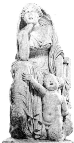
▲图 1-2 忒提斯女神和小海神特里同 (Museo Nazionale Romano, Rome, Italy)

然而，更普遍的说法是，这是神秘命运使然。按照古希腊抒情诗人品达的说法，宙斯和波赛冬都狂热地追求忒提斯女神，两人成了情敌，眼看就要闹翻了，诸神急忙开会给他们调解。有预言能力的正义女神忒弥斯说，(图 1-3)忒提斯的儿子将来要比他的父亲更强大，而且他的武器也要比宙斯的霹雳武器和波赛冬的三股神叉威力强得多。忒弥斯建议，凡间有位英雄，名叫珀琉斯，品性正直，不妨让忒提斯嫁给他，他们的儿子再强大，再有本事，也不过是个凡人，不会对神界的统治构成威胁，最终会死在战场上。两位大神听了女神的预言，谁也不敢娶这位海女神了，并一致同意她的建议，把忒提斯嫁给凡人。还有一种说法，普罗米修斯知道这个对宙斯不