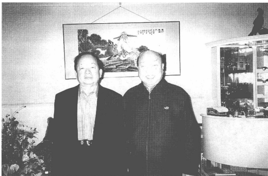
贺普仁教授与前国务院副总理田纪云在一起