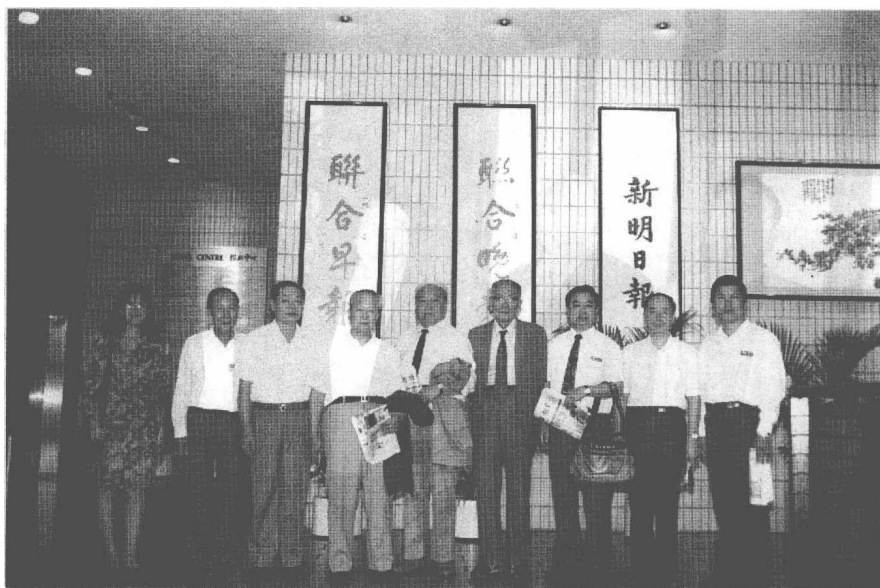
賀普仁教授在新加坡访问讲学