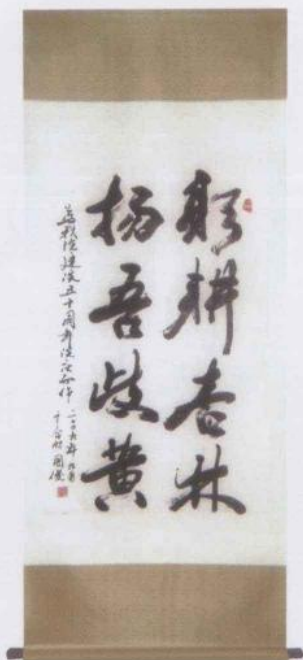
2009年9月书于省中医院建院五十周年之际