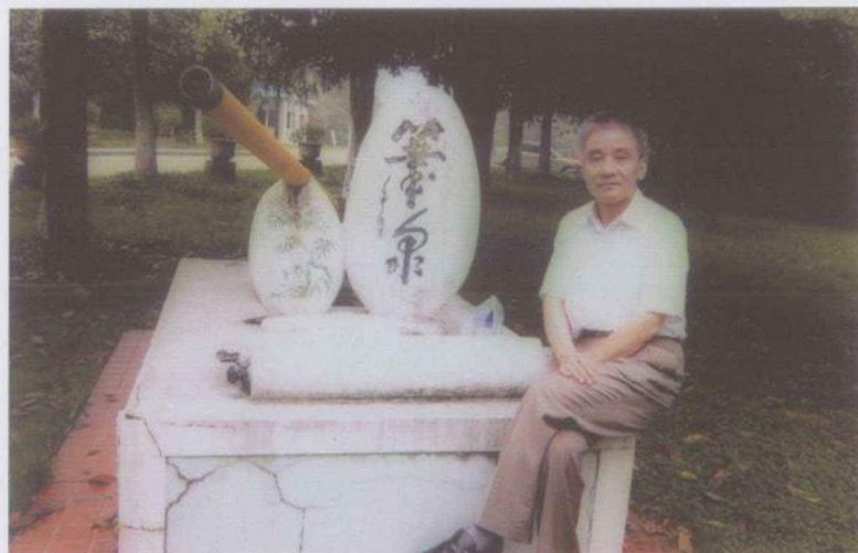
2007年8月摄于合肥董铺岛中国科学院合肥分院