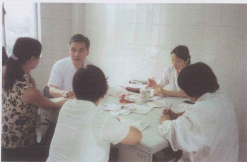
2003年6月摄于省中医院呼吸内科诊室临床带教