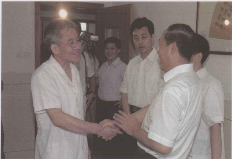
省委副书记王明方、副省长谢广祥亲切看望胡国俊导师