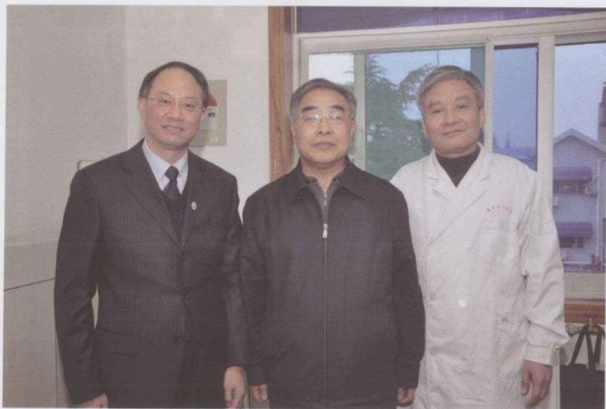
2009年12月与来院考察的张伯礼院士及校领导合影