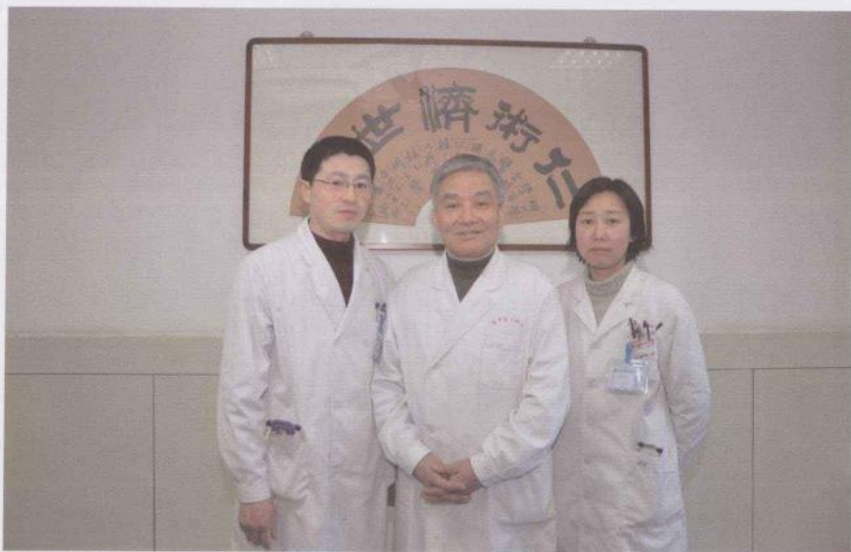
2008年11月与第四批全国老中医药专家学术经验继承工作继承人合影