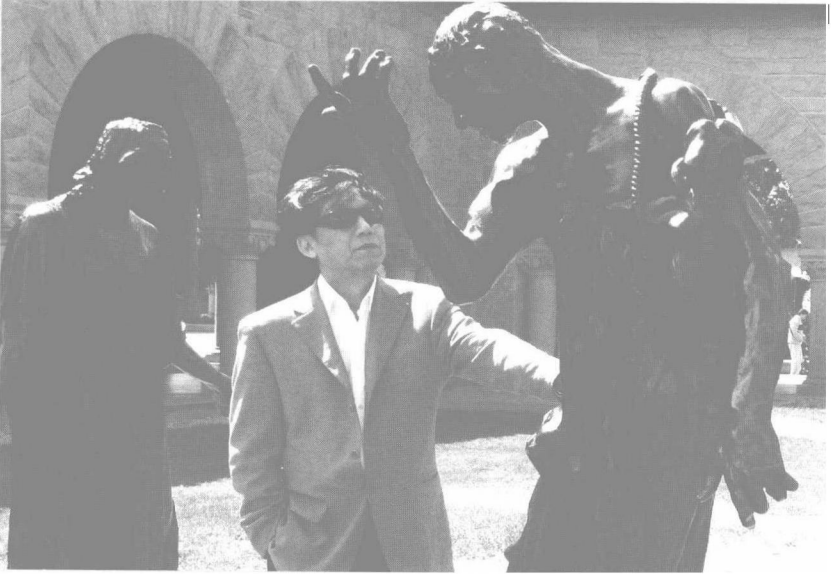
2007年4月在斯坦福大学