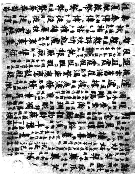
斯三八八號《羣書新定字樣》圖版(一)

研究之一》(臺北《華岡文科學報》第十七期,一九八九)、張涌泉《敦煌俗字研究》等都對本篇作過評介;張金泉還對本篇進行過校勘,見於《敦煌音義匯考》一書中,都可以參看。為了盡可能反映唐代「字樣」的原貌,除附寫卷圖版於首外,標目字盡量按底卷逐錄(但為排版方便,必要時也作少量楷定),同時把正字或後世通行的寫法括注其下(後世通行的寫法不一定是唐代人認為的正體),而不再一一出校說明。