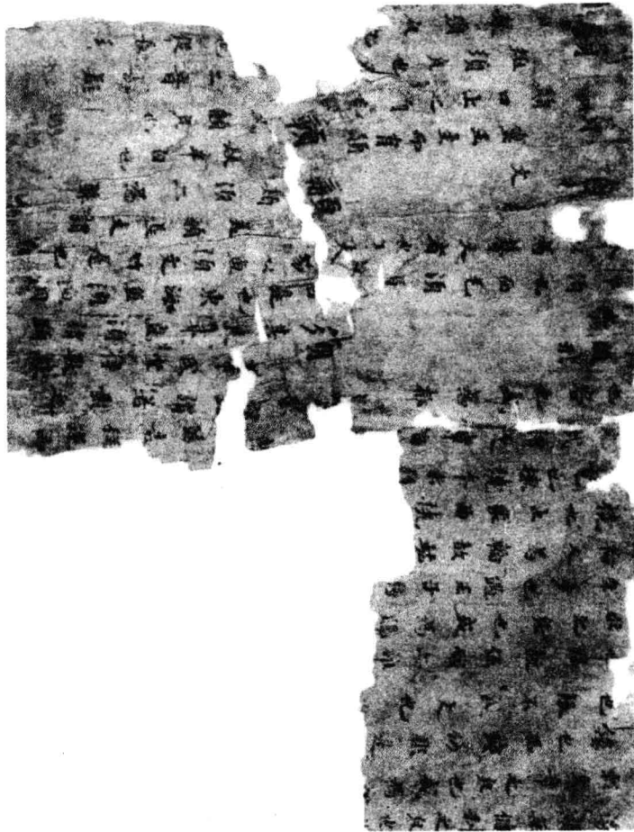
俄敦一三九九背、俄敦二八四四B背 (底一) 圖版