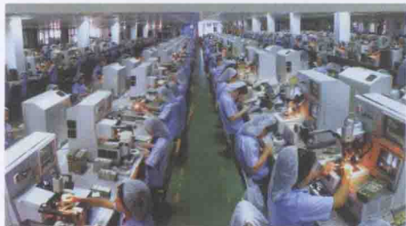
涵江四大支柱产业之一电子信息