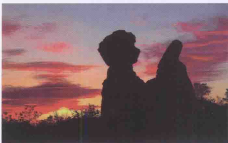
涵江八景之“永兴画嶂”