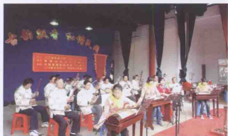
国家级非物质文化遗产“文十番”