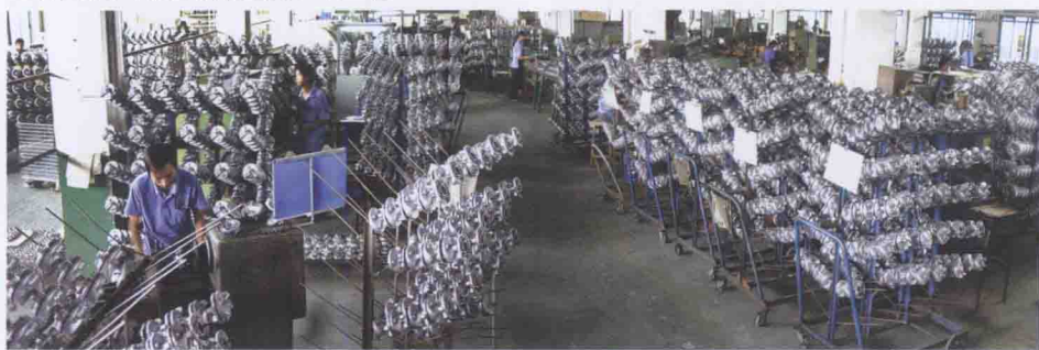
全国最大的出口摩托车制动器生产基地