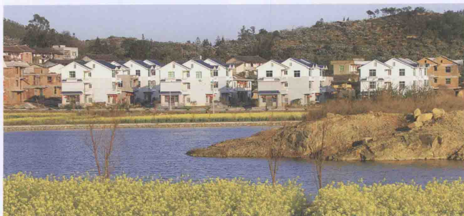
全省新农村建设精品村坪盘村