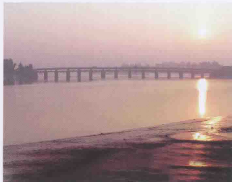
涵江八景之“宁海初日”