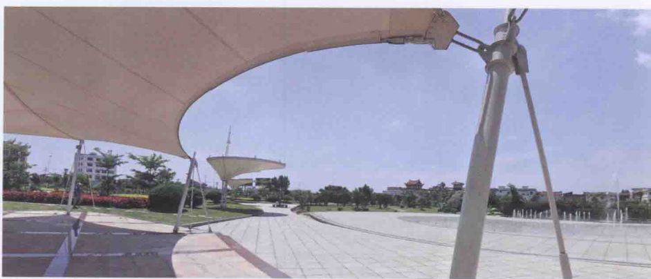
高新区科技文化广场