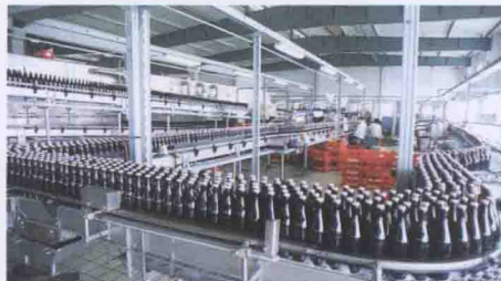
百威英博雪津啤酒生产线