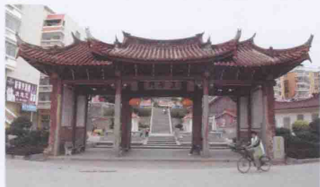
涵江孔庙遗址“正学门”