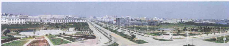
莆田高新技术产业开发区