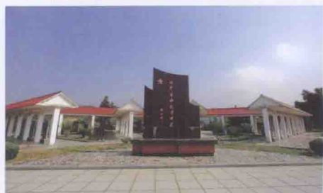
闽浙赣游击纵队闽中支队司令部遗址