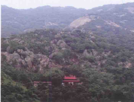
涵江八景之“古囊列嶂”