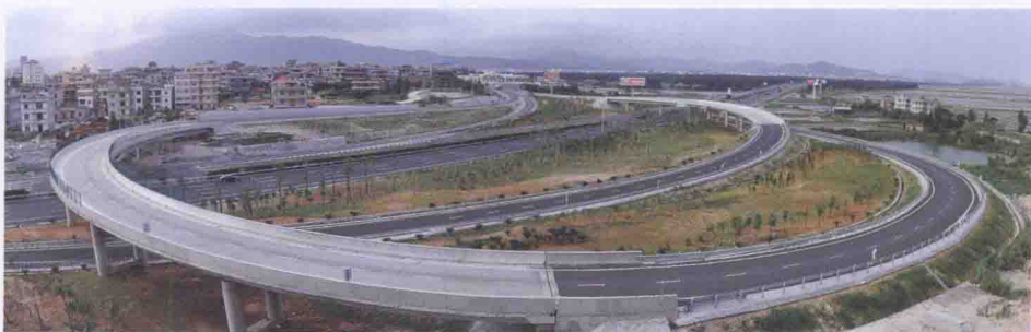
福厦高速涵江互通口