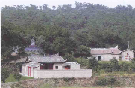
涵江八景之“夹漈草堂”