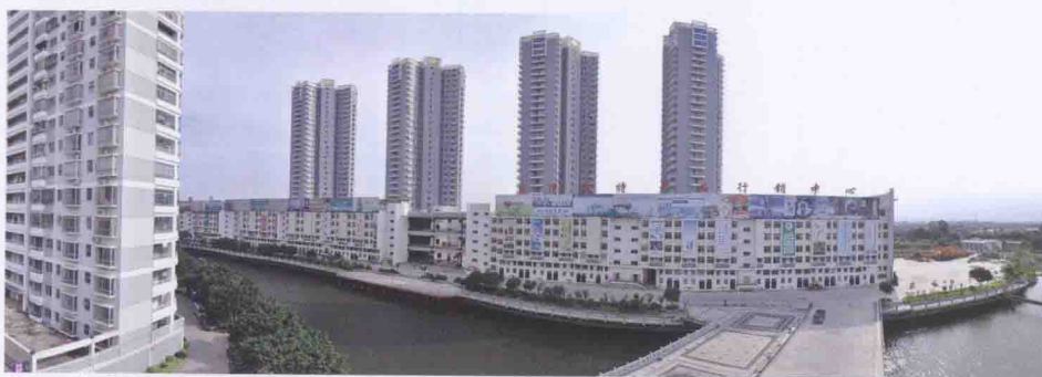
涵江商贸批发中心茶叶批发城