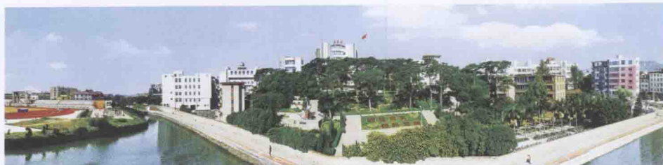
福建省一级达标校莆田六中