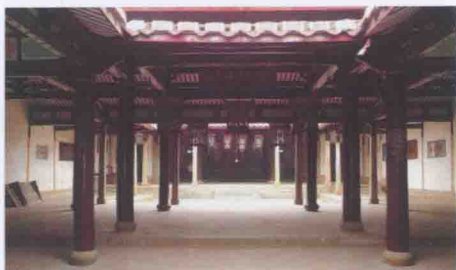
唐代名儒黄璞故居