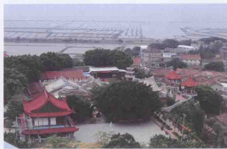
涵江八景之“雁阵归舟”