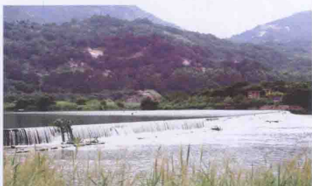
始建于宋代的南安陂