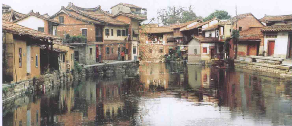
有“东方威尼斯”之称的涵江老城区