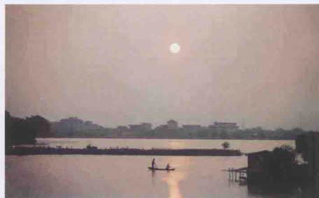
涵江八景之“白糖秋月”