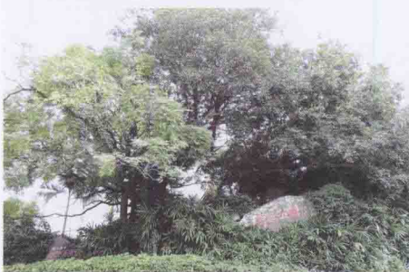
涵江八景之“锦江春色”