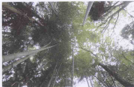
涵江八景之“望江竹浪”