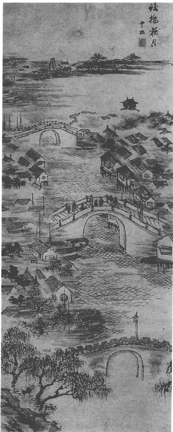
《蛟桥夜月》史云桥 / 作

宜兴的人中豪杰隐逸于一千多年恢宏的文化长卷里，印证着一方灵山秀水的气场是何等充沛。