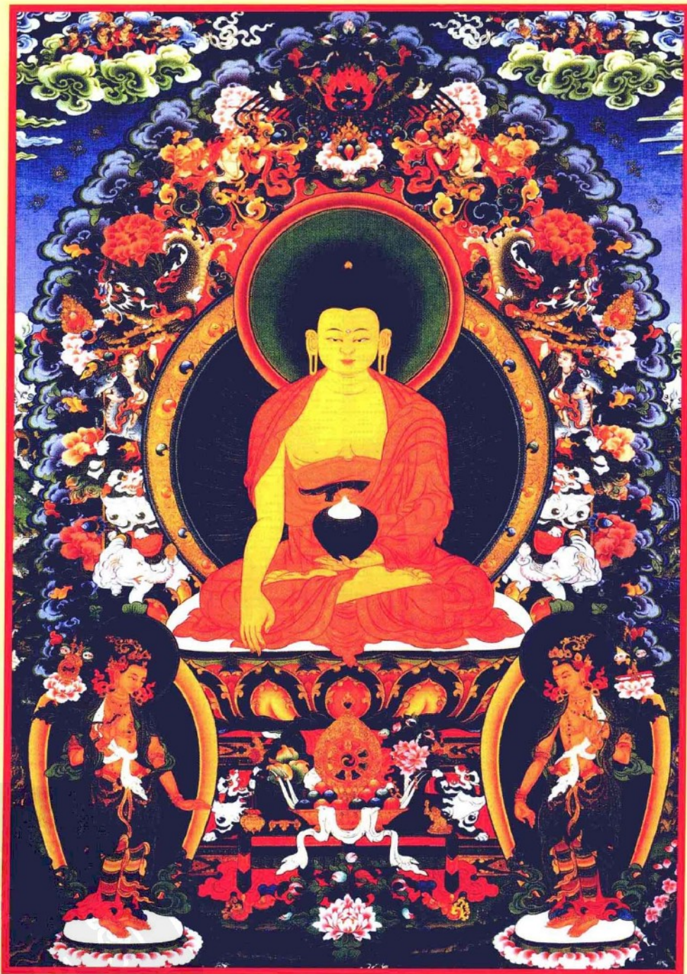
南无本师释迦牟尼佛