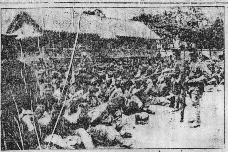
在日兵監視中之國軍俘虜

東北政務委員會於五月一日在瀋陽舉行第一次會議。會議由主任委員主持，討論了當前東北之政務及經濟建設問題。會議決定加強地方行政機構，提高行政效率，並積極發展生產，改善民生。會議還討論了如何加強與中央及各省市之聯繫，以共同抗戰建國。