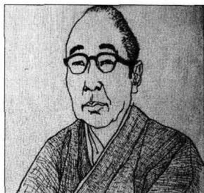
江戸川乱歩 Edogawa Ranpo (1894—1965)