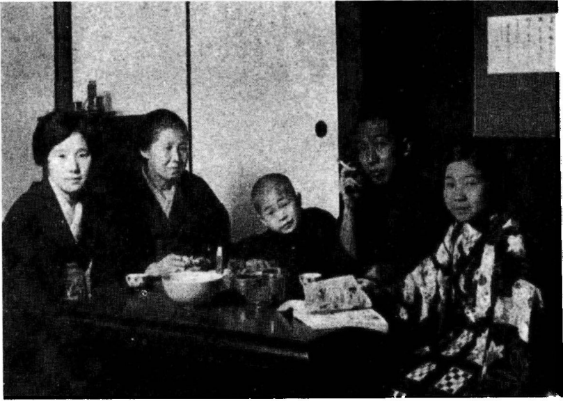
家族照，左起为妻子、母亲、长子、乱步及乱步妹妹。