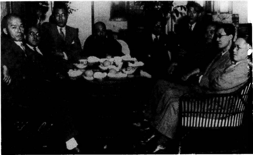
左起分别为森下兩村、甲贺三郎、延原谦、江戸川乱步、横沟正史、桥本五郎、大下宇陀儿、水谷准、海野十三。（一九三二年在东京府南葛饰郡寺岛町发生了玉之井御齿黑沟杀人事件。为找出凶手，当局多次向推理作家征集意见，此为十月份意见会的纪念照。）