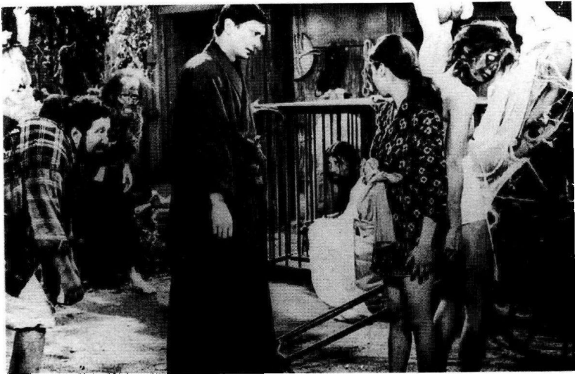
导演石井辉男的作品，取材于乱歩的《孤岛之鬼》和《帕诺拉马岛奇谈》。