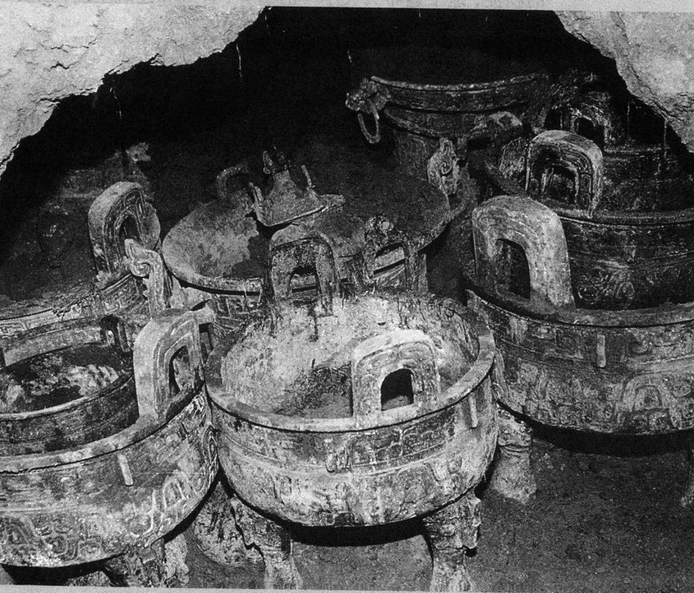
2003年1月19日，宝鸡眉县杨家村5村民意外发现窖藏青铜器27件，被评为2003年全国十大考古发现之一。