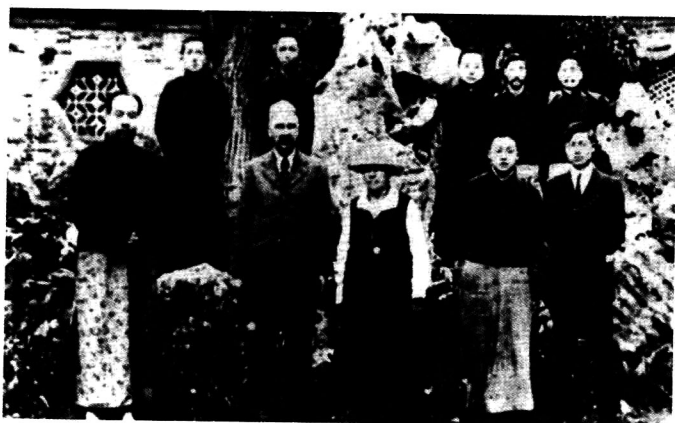
杜威夫妇在南京 (1920年5月10日)