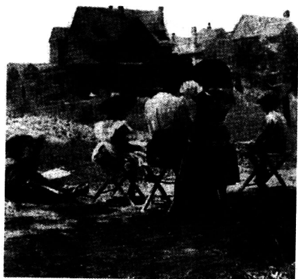
杜威学校 (芝加哥, 爱丽丝大街 5412号)