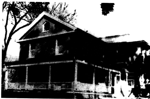
杜威出生地 (佛蒙特州伯林顿 市南维拉德大街 186号)