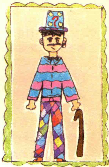
姑父的自画像多好笑！

他一点不知道我们强打精神拨打电话是为了帮助他的妻子，而且他丝毫不相信世界上确实有金发仙子，他心甘情愿做天下第一号笨蛋。