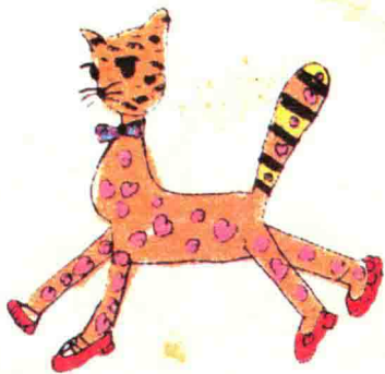
朱咪咪是一只骄傲的猫。

我养的那只猫也有两个名字，大名叫朱咪咪，意思是朱家的猫；小名不怎么好听，叫臭美。朱咪咪是天下最爱出风头的猫，总蹲在窗台上左右顾盼，还爱拍风景照，另外，它似乎还有跳迪斯科的天才。每次我关紧门窗，把爵士乐放得震耳响时，它就会又蹦又蹿，团团乱转。假如我再蹬响地板为它助兴伴舞，它更是双脚乱跳，无限疯狂。