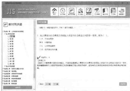
图3 “教材同步题”板块

该板块中的题目与配套教材中每章末的自测练习题一一对应，如图3所示。单击右下角的“显示标准”按钮，可以查看该题的答案和解析，以及读者作答的正误评判。