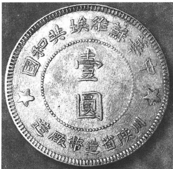
共和国川陕苏区造币厂铸造的银元（正面）。

当国家银行行长。他搞银行工作很出色。他到苏区以后，根据主席统一财政的指示，把货币统一起来…… 银行的钱不能随便用，须经财政部批准。这样一来，货币金融统一了，财政也就随之统一。 这是泽民同志的一大功劳”（注 12）。金融工作必须绝对处于党的统一管理之下，这与华尔街跨国金融情报体制宣扬和控制下的各国“独立央行”体系截然不同，是红色金融与金融殖民地的大分水岭。