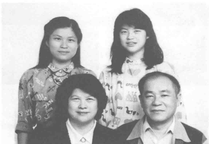
上图：一九八一年八月八日父亲节，家人到绿岛探视