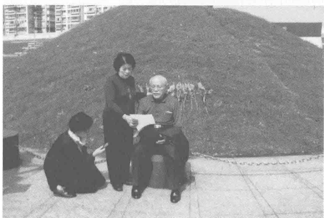
上图：二〇一〇年，参加人权博物馆的“重返绿岛”活动，在八卦楼牢房前