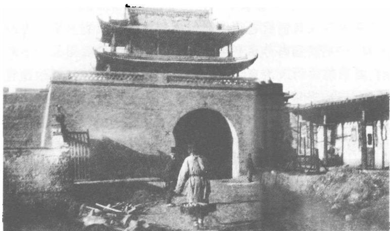
清末新疆迪化的北城门