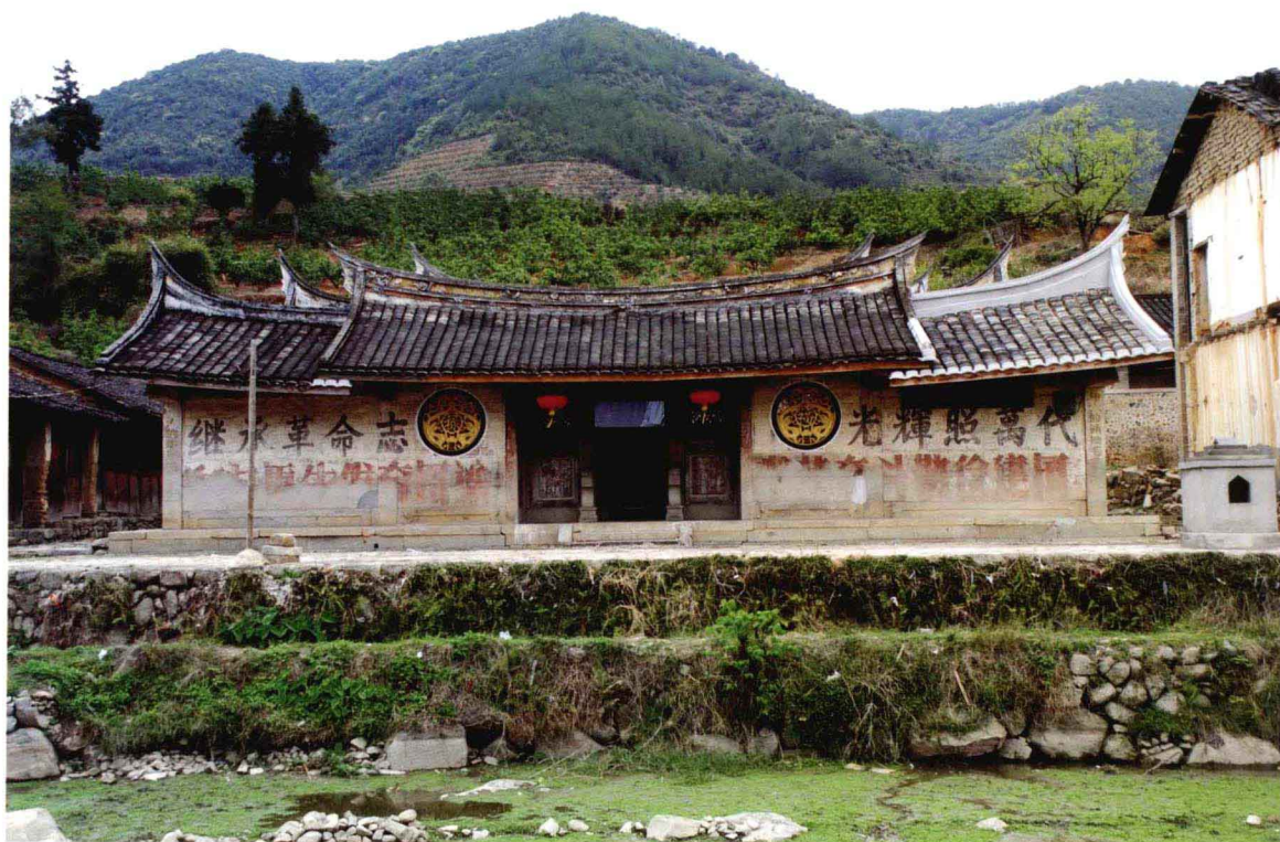
南昌起义军平和秀芦会议旧址

1927年10月11日，朱德、陈毅率领部分南昌起义部队在此召开干部会议，地方干部卢肇西、陈彩芹等同志列席会议，会议决定部队向永定方向挺进，并确定了向江西井冈山挺进的行军路线。