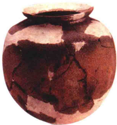
跨湖桥遗址出土的陶釜