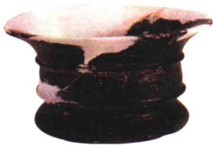
跨湖桥遗址出土的黑陶豆