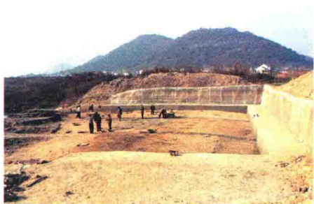
下孙遗址挖掘现场