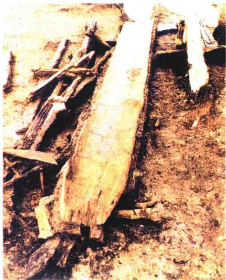
跨湖桥遗址独木舟遗迹

2004年12月，在第二次“跨湖桥考古学术研讨会”上，以跨湖桥遗址为代表的这一史前文化被正式命名为“跨湖桥文化”。专家们一致认为，跨湖桥遗址最早的年代可到距今8000