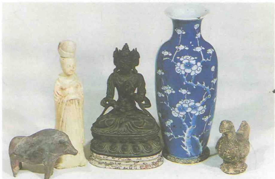
鲁迅收藏的部分古代文物