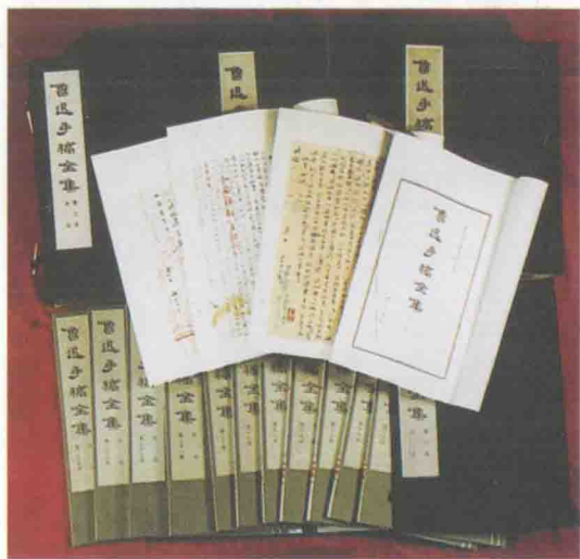
北京鲁迅博物馆编辑的《鲁迅手稿全集》六函，文物出版社出版，1986年全部出齐。