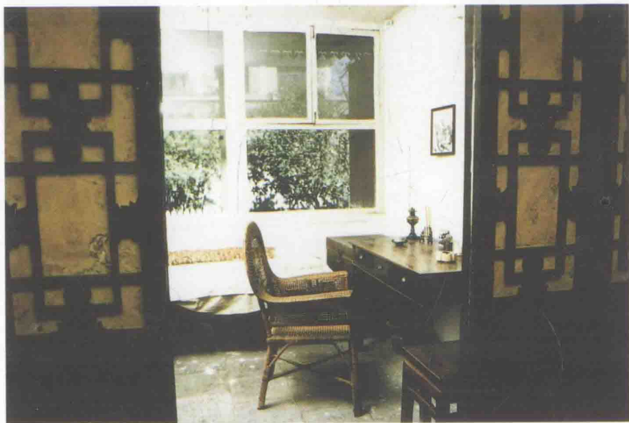
鲁迅的卧室兼工作室“老虎尾巴”