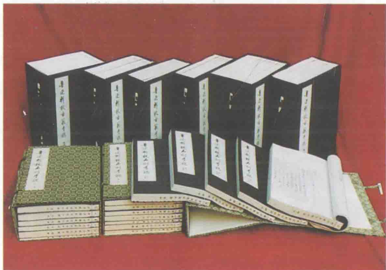
北京鲁迅博物馆与上海鲁迅纪念馆编辑《鲁迅辑校古籍手稿》、《鲁迅辑校石刻手稿》，由上海古籍出版社、上海书画出版社于1993年出齐。