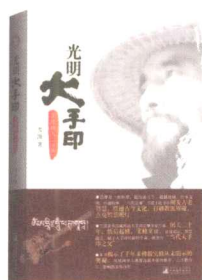
光明大手印 实修顿入（下卷）