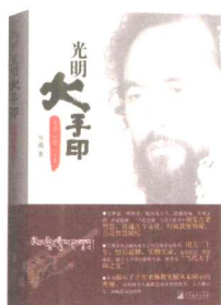
光明大手印 实修心髓（上卷）