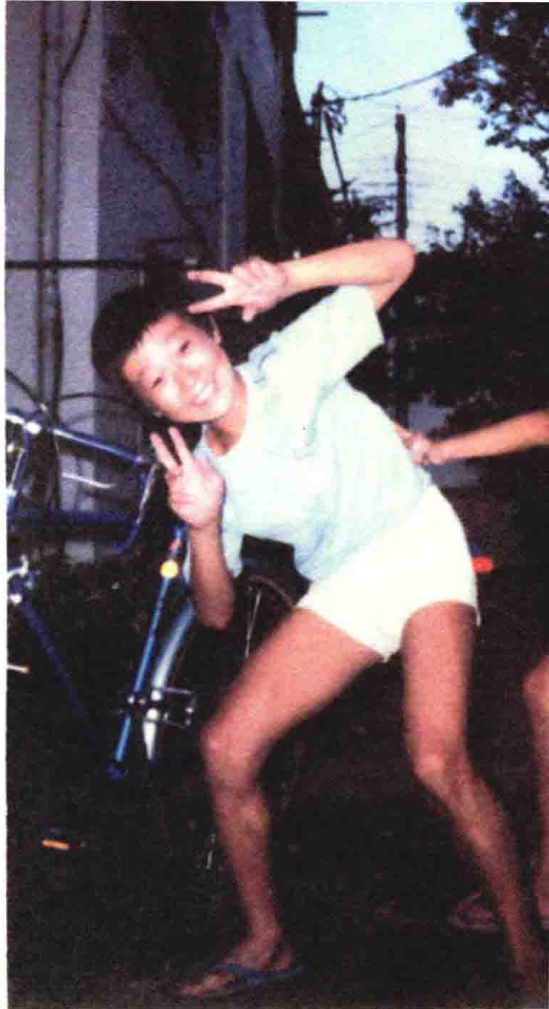
小时候，我觉得自行车比电动游戏机更有趣。