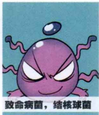
致命病菌，结核球菌