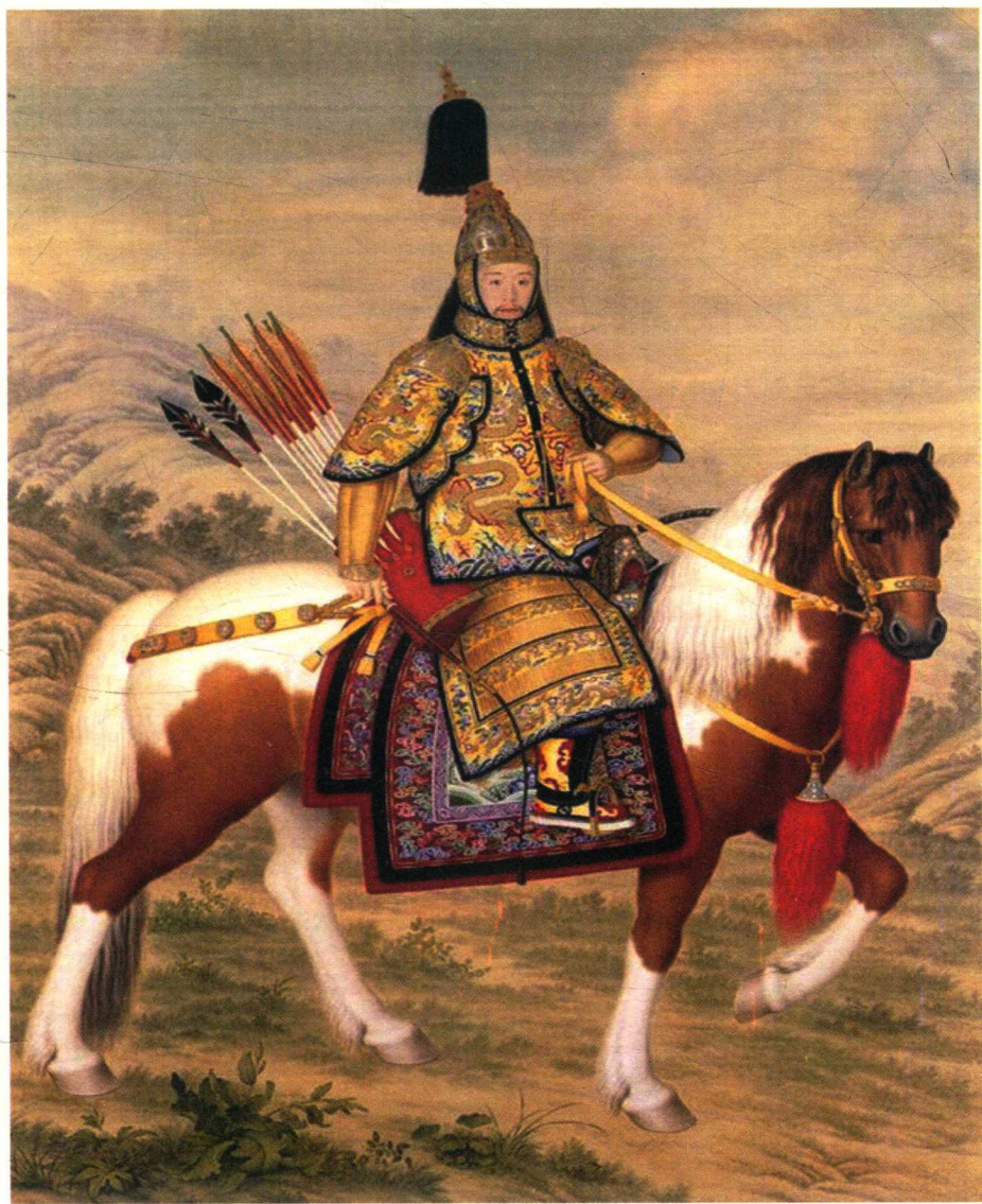
《乾隆狩猎图》，郎世宁绘