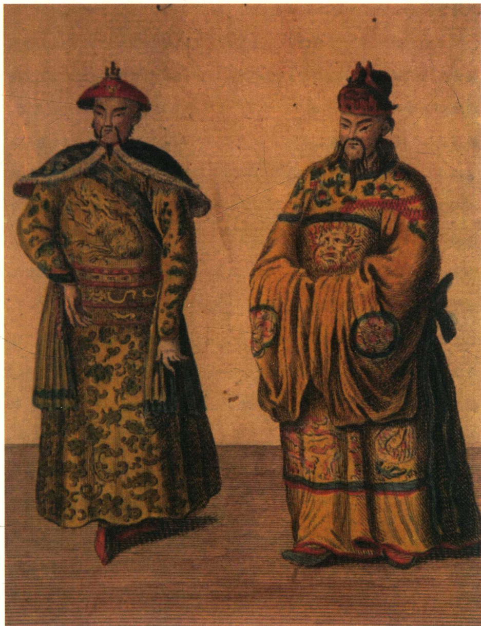
来华传教士绘制的中国皇帝像