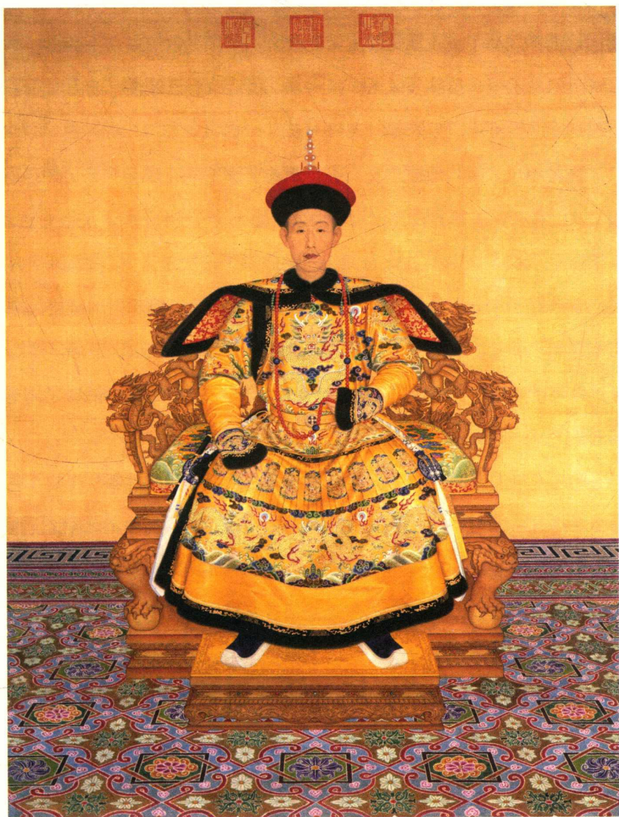
乾隆皇帝朝服像，郎世宁绘