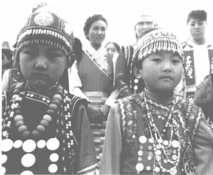
裕固族儿童