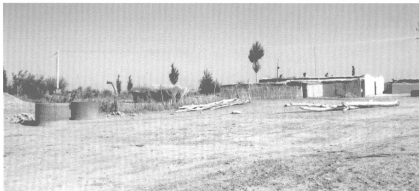
定居牧民院落 (钟进文供稿)