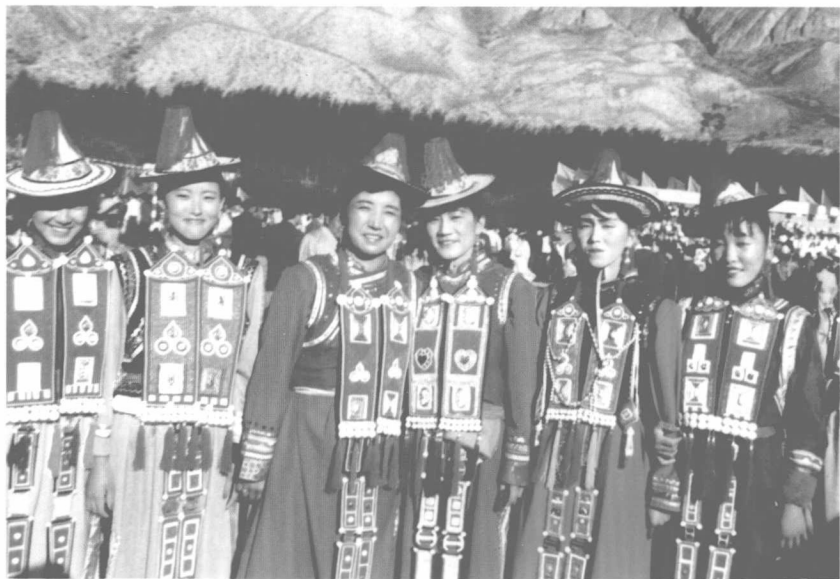
裕固族妇女