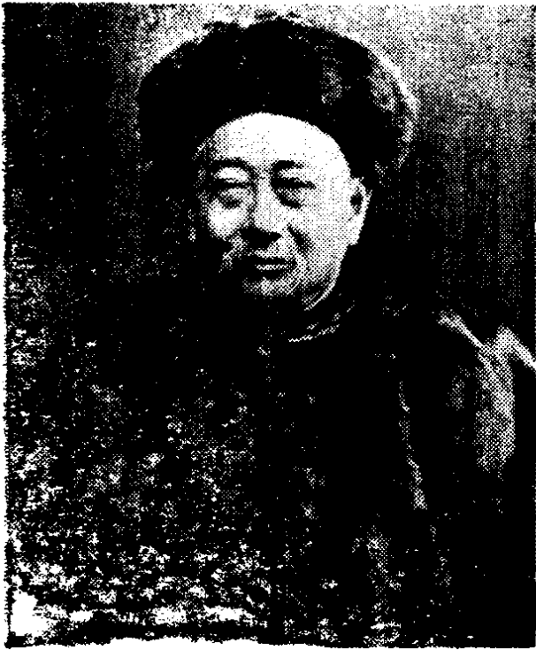
中国驻英公使郭嵩焘(在伦敦时)