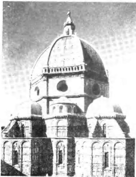
布鲁涅列斯： 佛罗伦萨圣玛 利亚大教堂