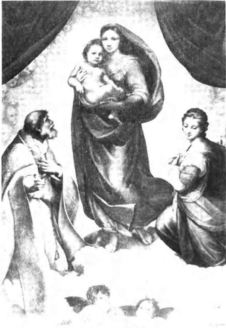
拉斐尔：西斯廷圣母