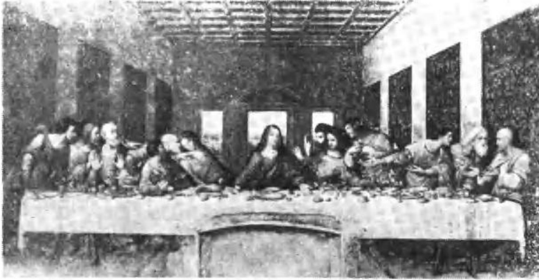
达·芬奇：最后的晚餐