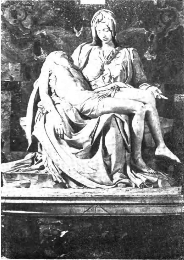
米开兰基罗，哀悼基督