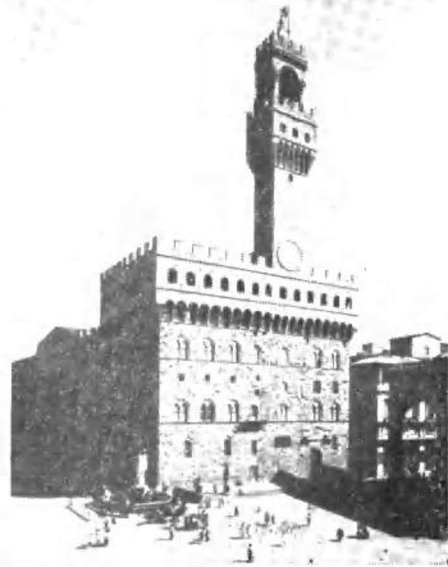
佛罗伦萨市政 厅（老宫）