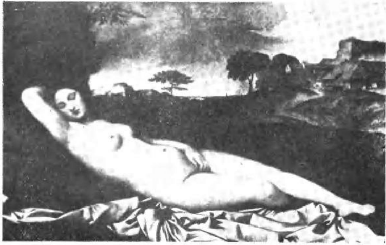
乔尔乔内：酣睡的维纳斯