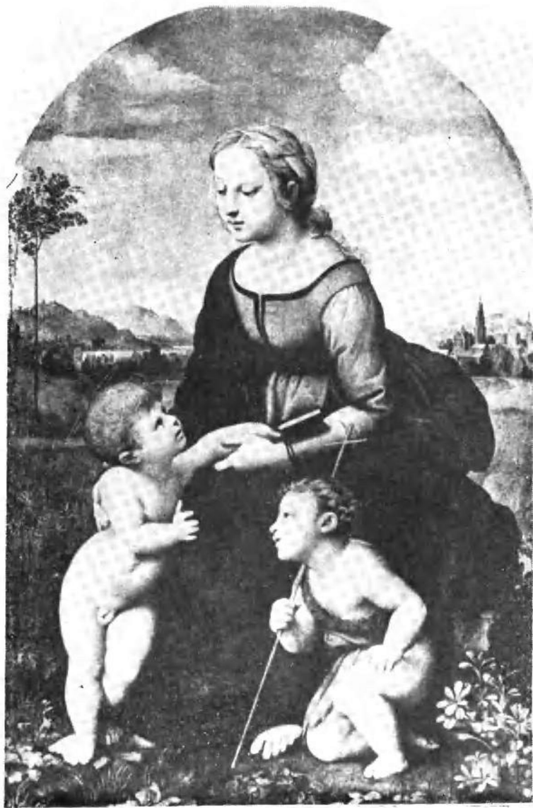
拉斐尔：花园中的圣母