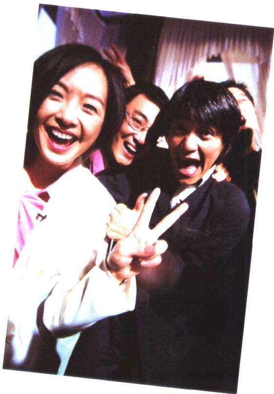
申奥成功的那一天。 旁边是窦文涛和周星驰。