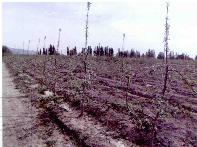
3年生三优一体密植苹果园