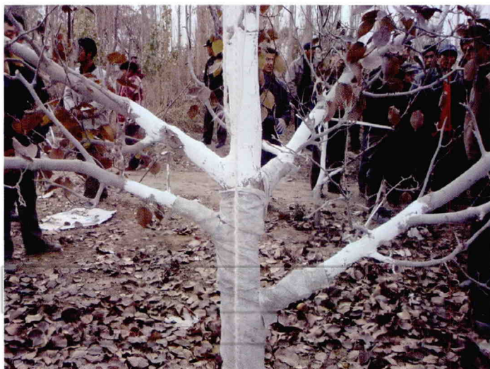
库尔勒香梨幼树包扎防