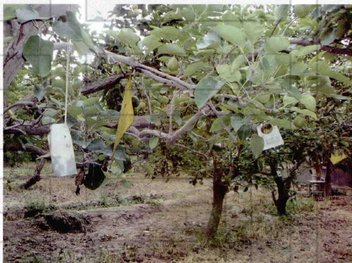
库尔勒香梨生物防治