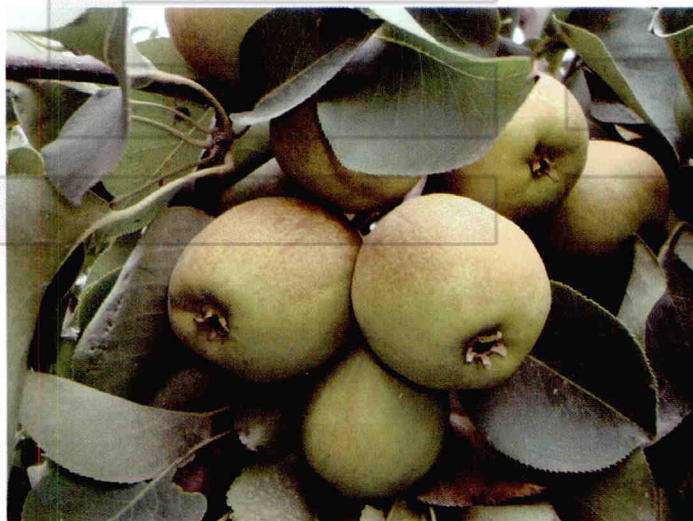
库尔勒香梨累累果实