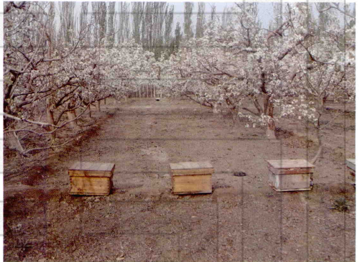
库尔勒香梨果园放蜂