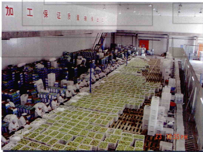
库尔勒香梨包装车间