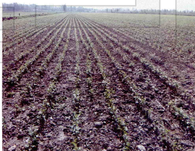
苹果春季枝接育苗