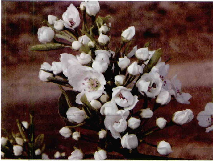
库尔勒香梨25%开花时授