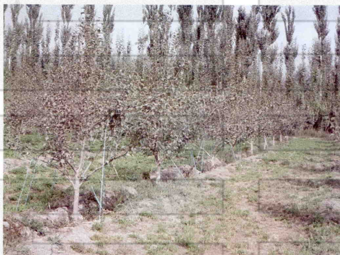
4年生乔化密植苹果园