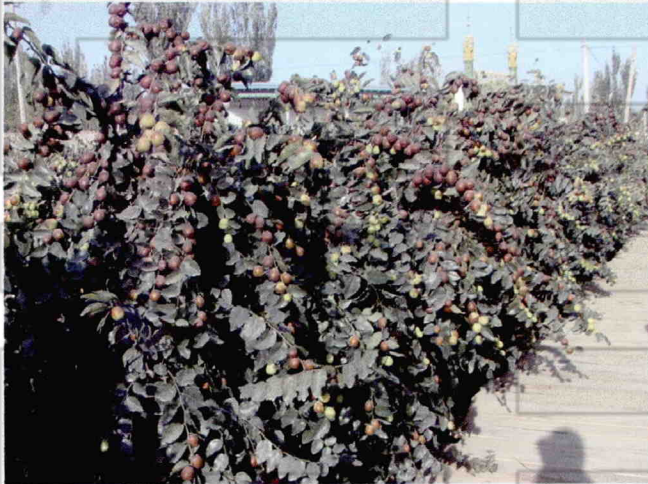
赞皇大枣结实盛状