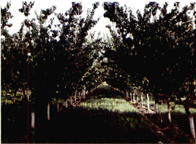
杏树矮化密植拉枝开张角