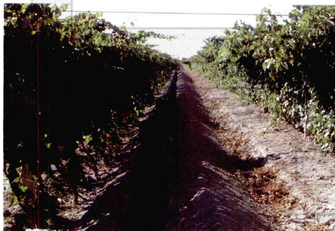
葡萄园开沟施有机肥